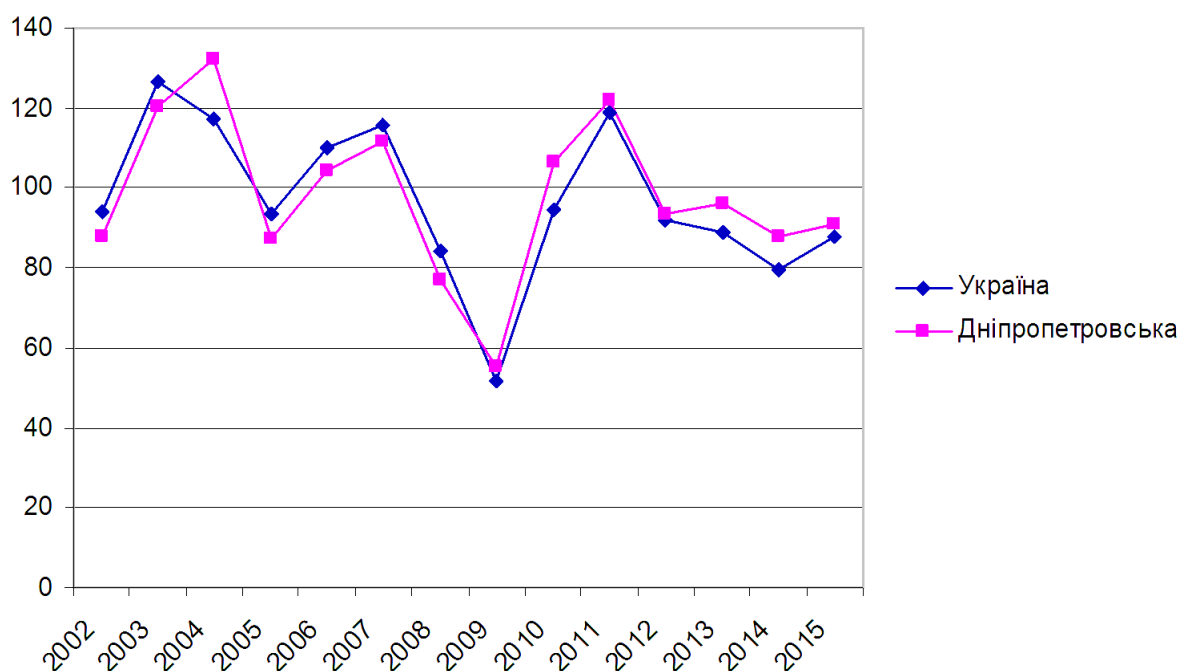
Рис. 2. Порівняльна динаміка індексів обсягу виконаних будівельних робіт в Україні та у Дніпропетровській області у 2002-2015 рр.

Зауважимо, що тенденції стрімкого зростання вартості житла, що спостерігалися в житловому будівництві в 2005-2008 роках базувалися на хибних переконаннях приватних інвесторів щодо надійності інвестицій в придбання житла з метою збереження та примноження заощаджень. При цьому оцінка динаміки індексів будівництва в Україні у 2002-2015 рр. дозволяє встановити, що найбільш