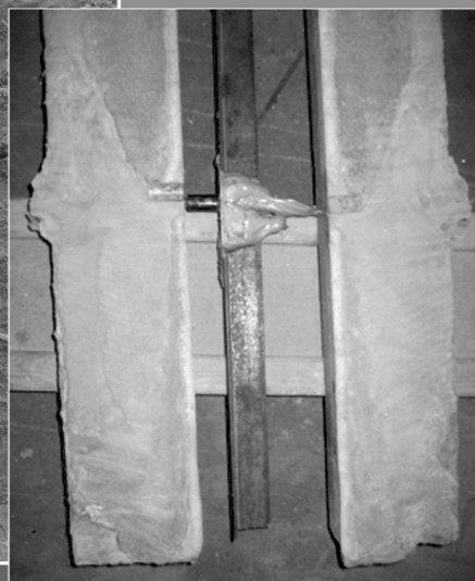
ЕКСПЕРИМЕНТАЛЬНІ ДОСЛІДЖЕННЯ ТЕХНОЛОГІЇ ГЕРМЕТИЗАЦІЇ СТИКІВ МАТЕРІАЛАМИ ПОЛІУРЕТАНОВИМИ SPT RESINS. с. 54