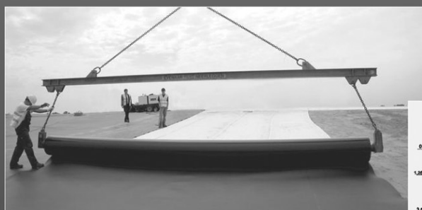
СВІТОВИЙ ДОСВІД ТА ПРОБЛЕМИ ВЛАШТУВАННЯ ГІДРОІЗОЛЯЦІЇ В УКРАЇНІ с. 3