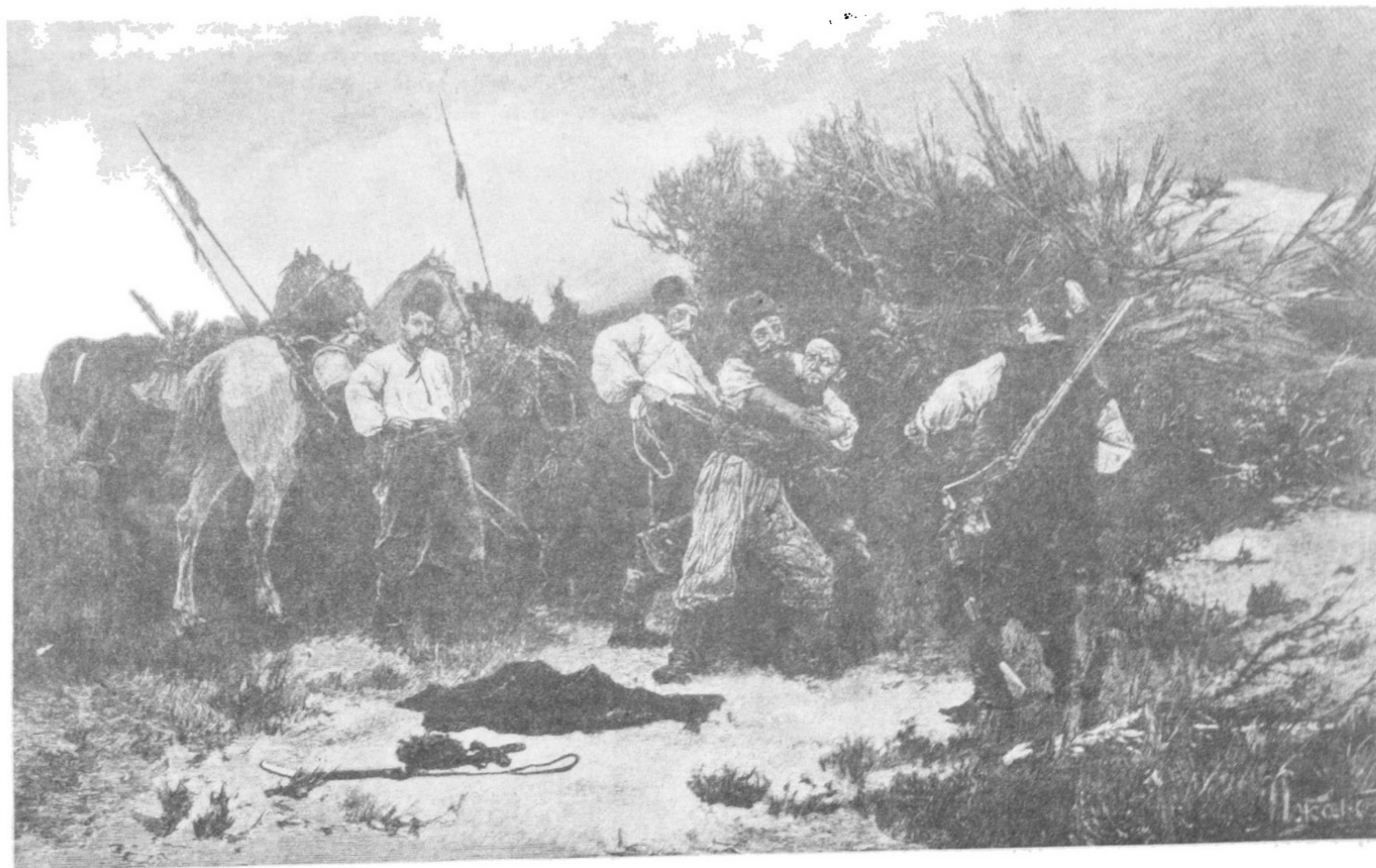
□ «Язик» спіймали. Оригінальний рисунок І.Іжакевича. Гравер Ращевський.