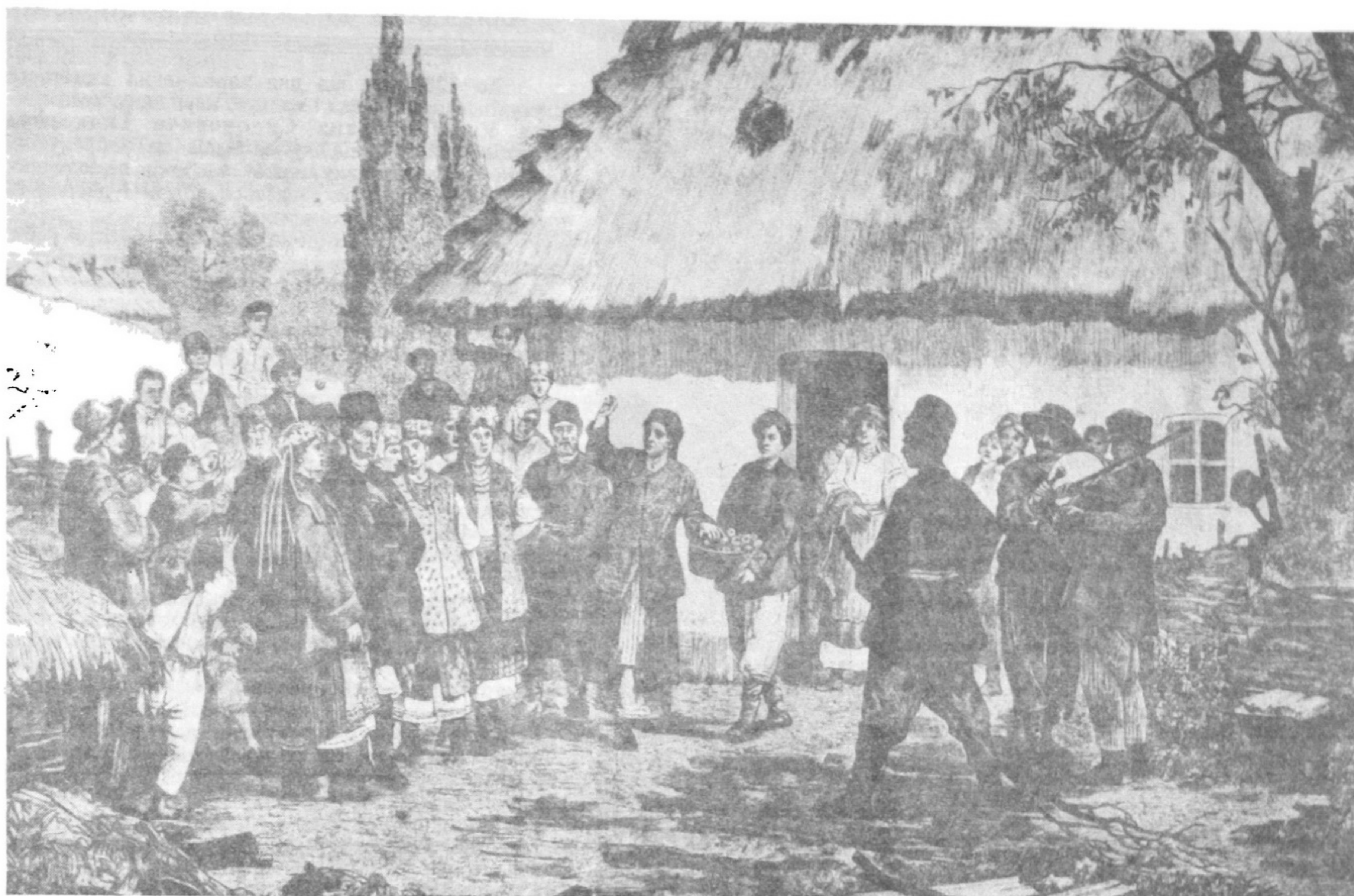
□ Веселий гурт. Оригінальний рисунок І.Іжакевича. Гравер Шюблер.