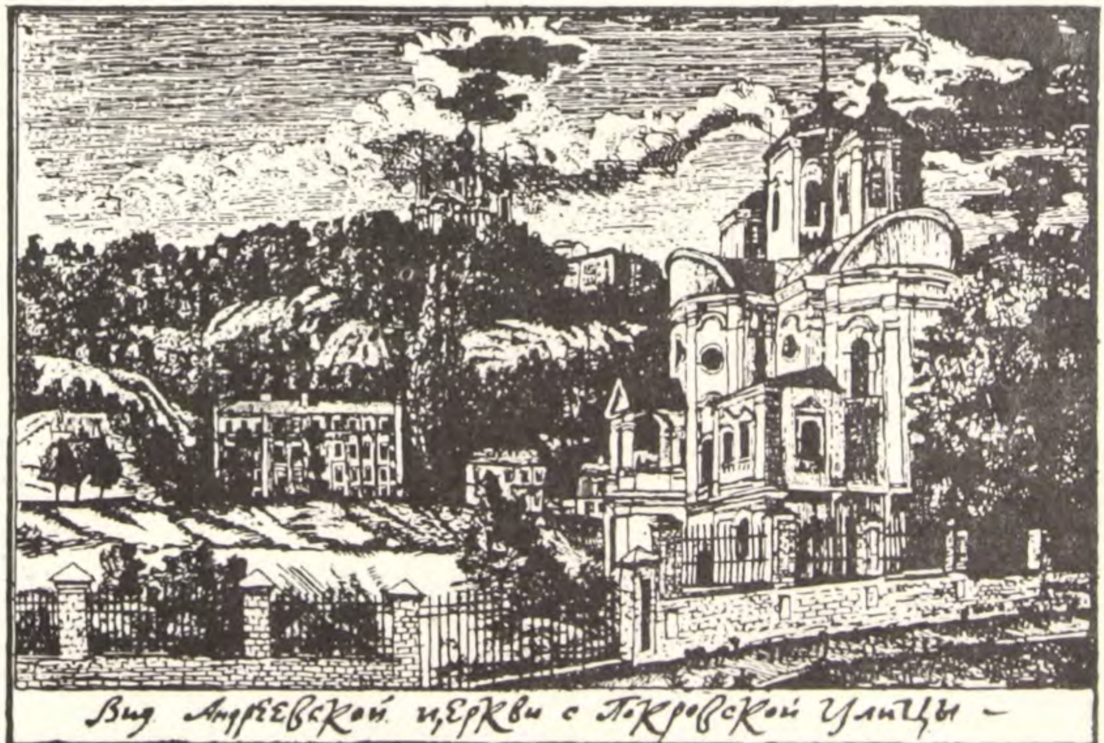
Вид Андріївської церкви з Локровської Улицы