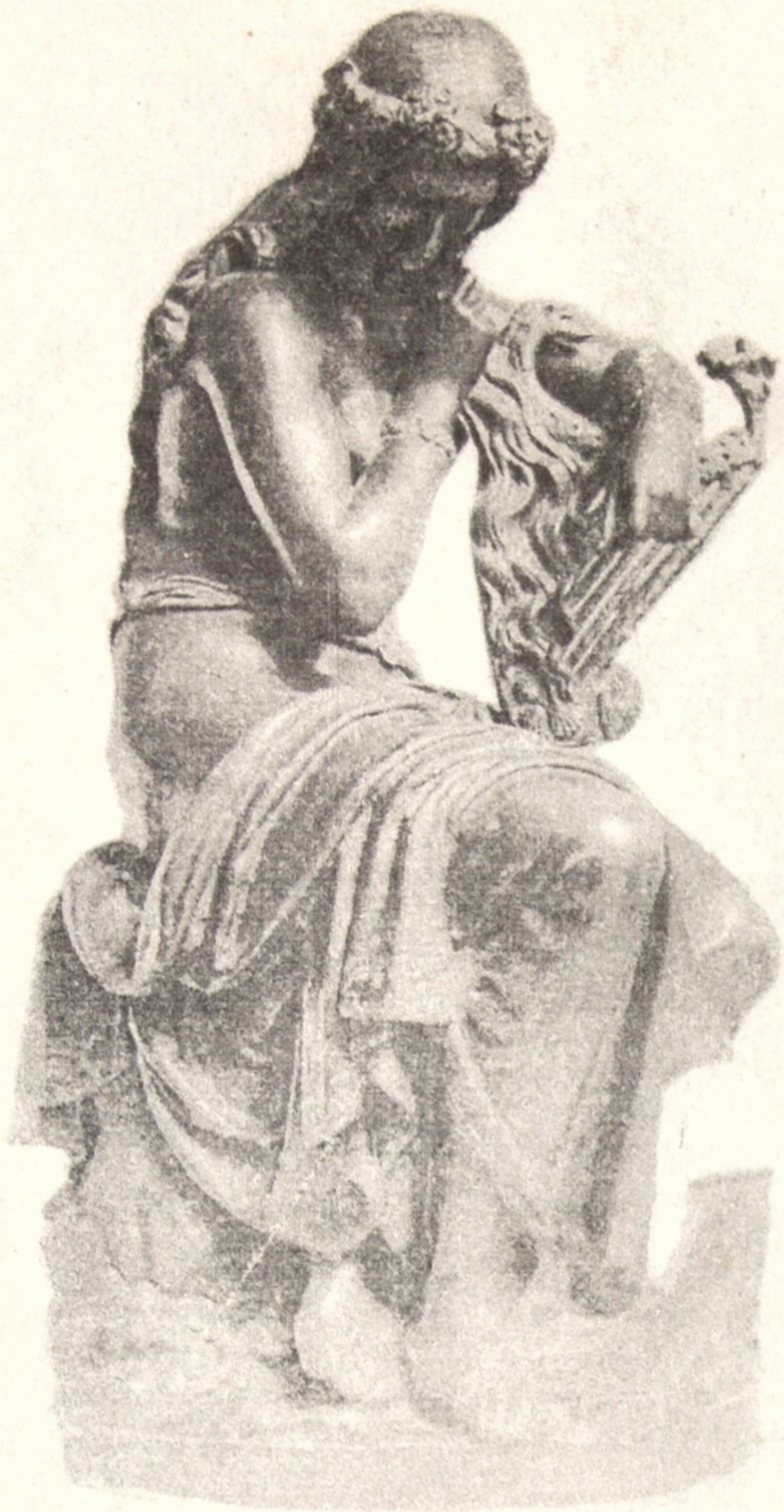
Рис.10. Гі Г. Лісова-німфа. Редукція, бронза. Париж. Між 1881 та 1892.