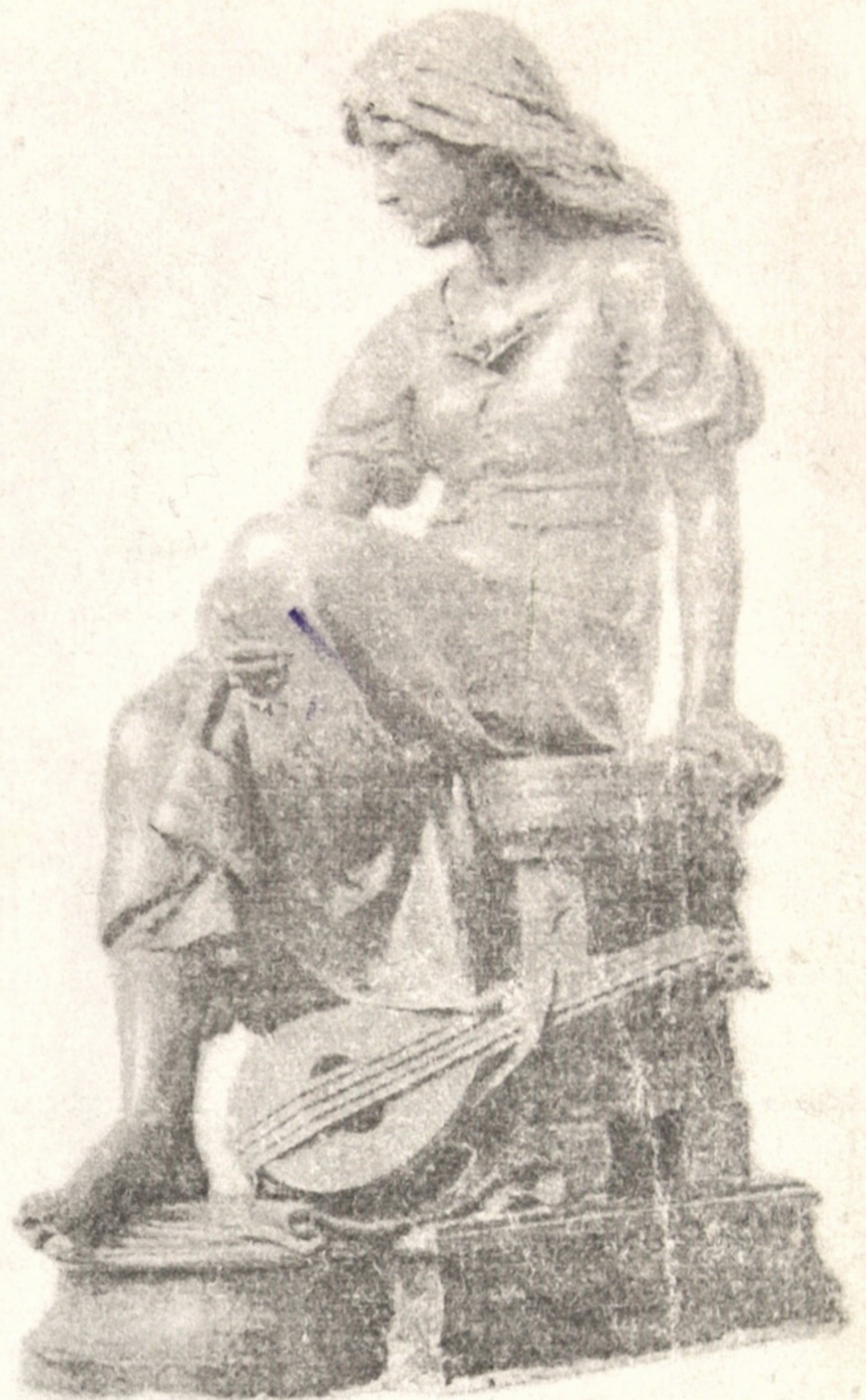
Рис.11. Езлен. Міньйона. Редукція, бронза. Париж. Між 1881 та 1892.