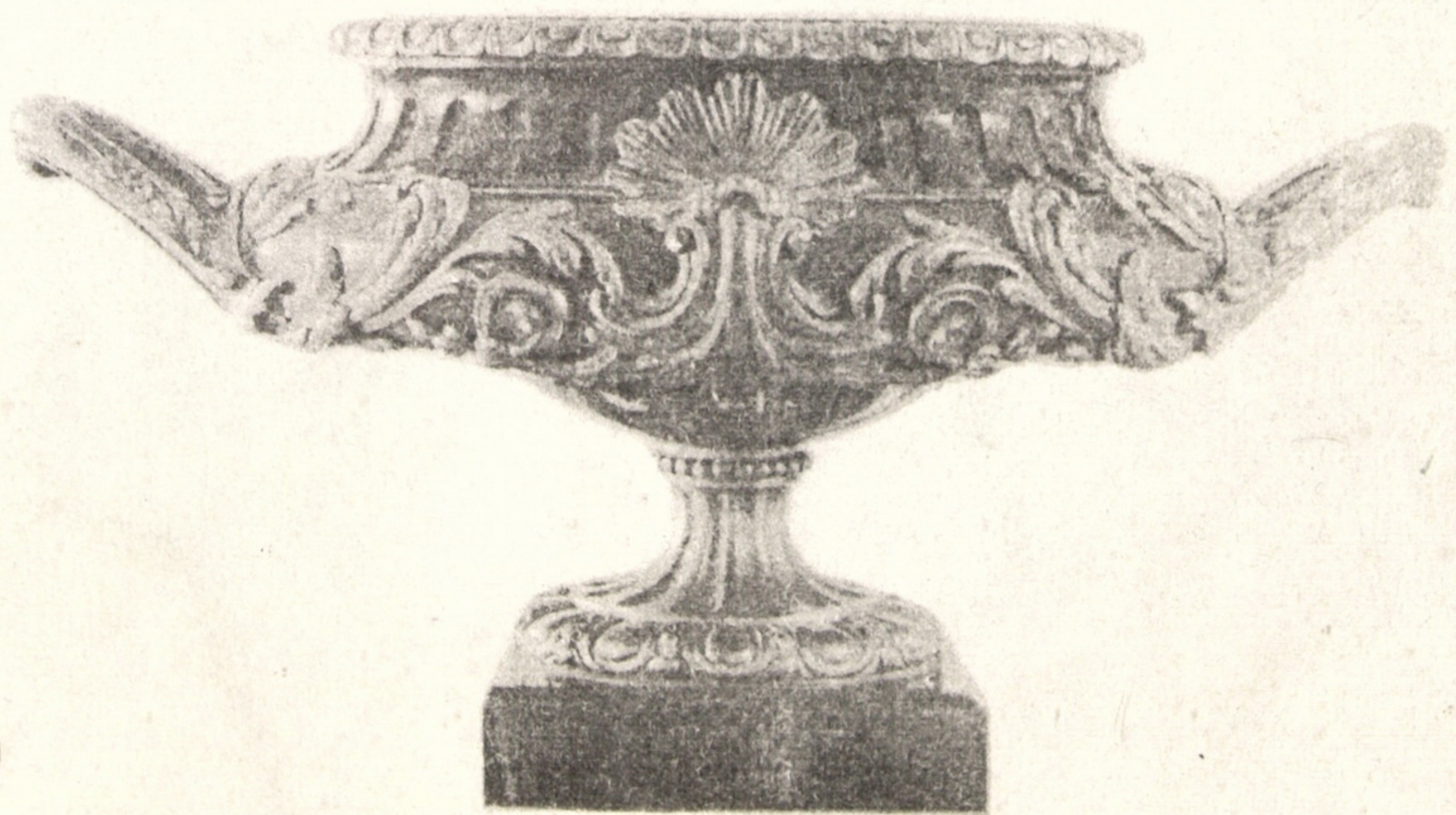
Рис.12. Декоративна ваза. Мармур, бронза. Париж. Друга пол. XIX ст.