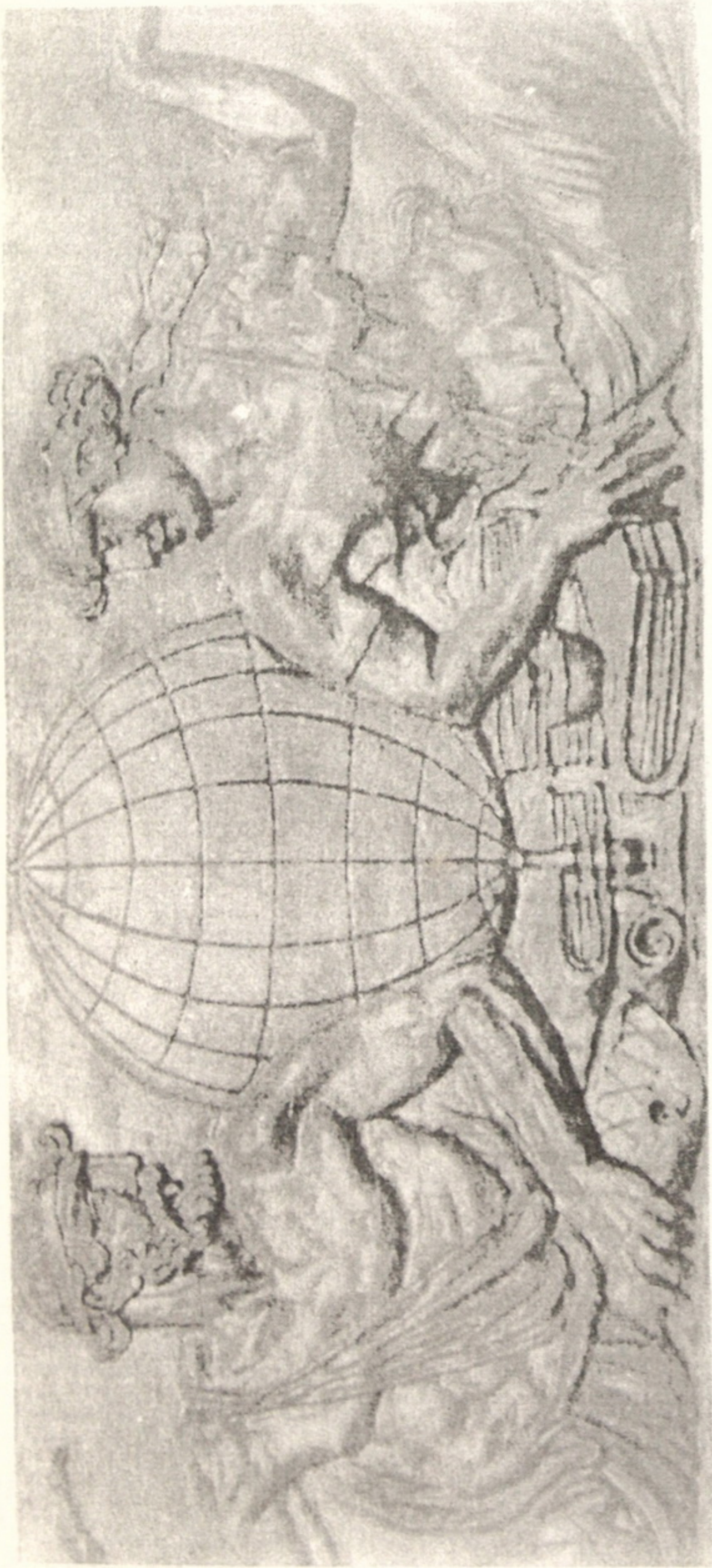
Рис. 7. В.Климов. Барельєф між сходами до третього поверху Бібліотеки. Гіпс. 1929.