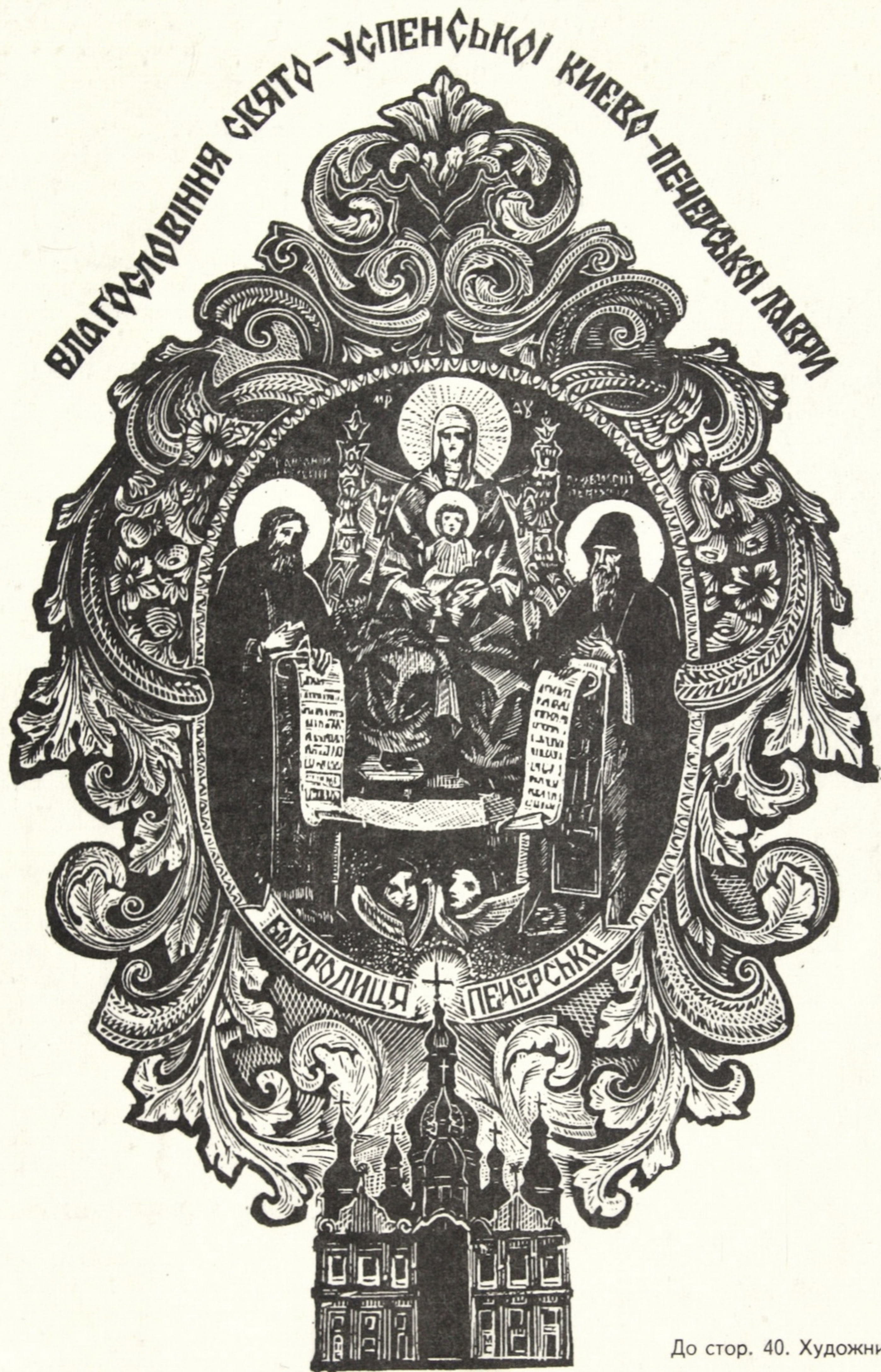
До стор. 40. Художник М.І.Стратілат