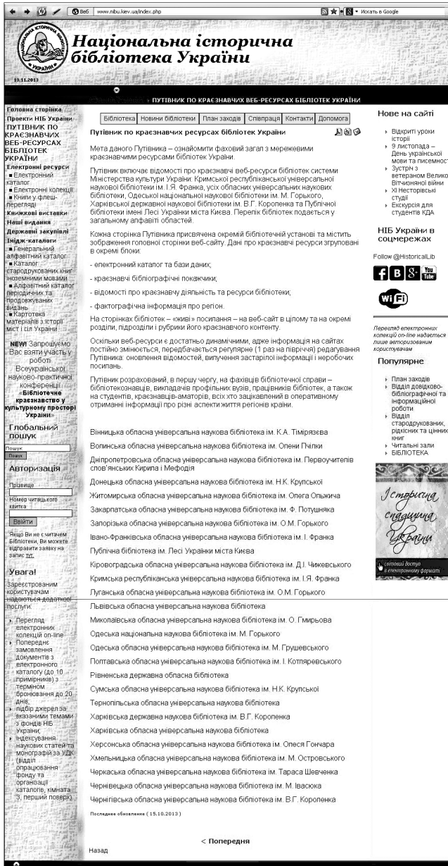
Рис. 1. Головна сторінка Путівника

Варто зазначити, що основним критерієм відбору краєзнавчих ресурсів ми обрали можливість вільного доступу до них, адже такий підхід найбільш актуальний для віддаленого користувача. Кожен із заявлених видів краєзнавчих ресурсів забезпечує швидкий перехід від одного інформаційного джерела до іншого.