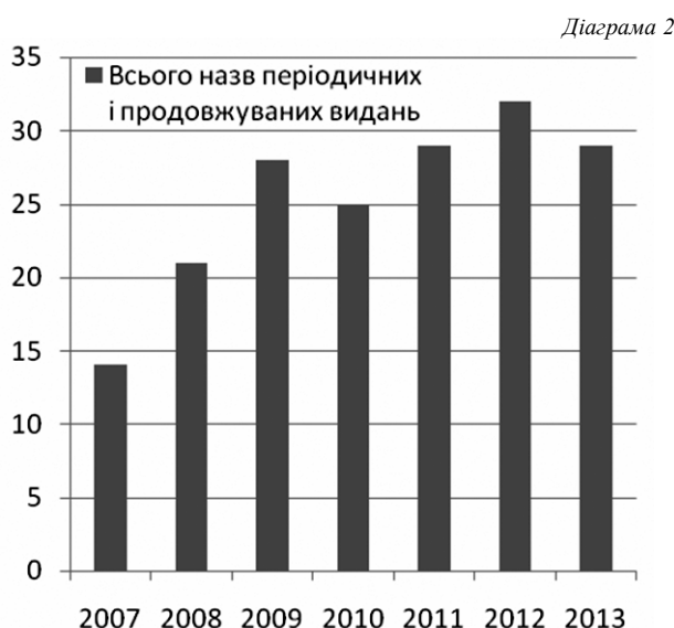
Динаміка відображення назв періодичних і продовжуваних видань з питань педагогіки, психології й освіти в чотирьох серіях УРЖ «Джерело» за 2007–2013 рр.

Якщо у 2007 р. реферувалося 14 назв періодичних і продовжуваних видань, то у 2012-му їх уже налічувалося 32. У 2013 р. в чотирьох серіях УРЖ «Джерело» було розміщено реферати на статті 14 назв з 20 назв видань (у 2012 р. – 20 назв із 20 назв видань), що реферуються ДНПБ України ім. В. О. Сухомлинського, та 9 назв з 22 назв видань (у 2012 р. 5 назв із 17 назв видань), що реферуються в рамках кооперативного проекту освітянськими бібліотеками. За рахунок зменшення назв періодичних видань, статті з яких реферує ДНПБ України ім. В. О. Сухомлинського, у 2013 р. за-