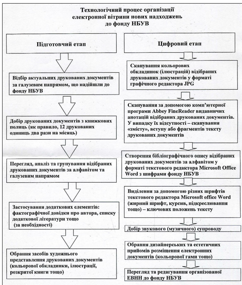
Блок-схема № 1. Технологічний процес організації електронної вітрини нових надходжень до фонду НБУВ

Узагальнюючи основні властивості ЕВНН до фонду НБУВ, можна констатувати, що: