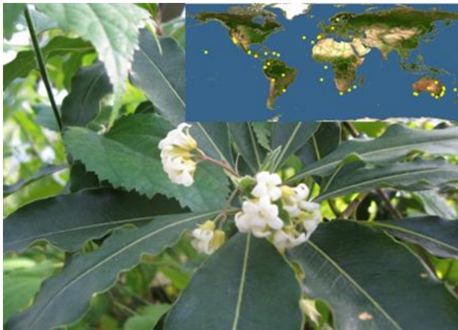
Рис. 5. P. undulatum (поширення в природі та вигляд в умовах інтродукційного пункту)

P. tenuifolium Gaertn – зростає на морському узбережжі, в гірських лісах, піднімаючись до 900м над рівнем моря, в Новій Зеландії. Поширений також в південній Австралії - Тасманія, Новий Південний Уельс, Вікторія, США - Каліфорнія (Hoskings et al, 2007), Бермуди (Varnham, 2009; EOL, 2013в) – див. рис. 6.