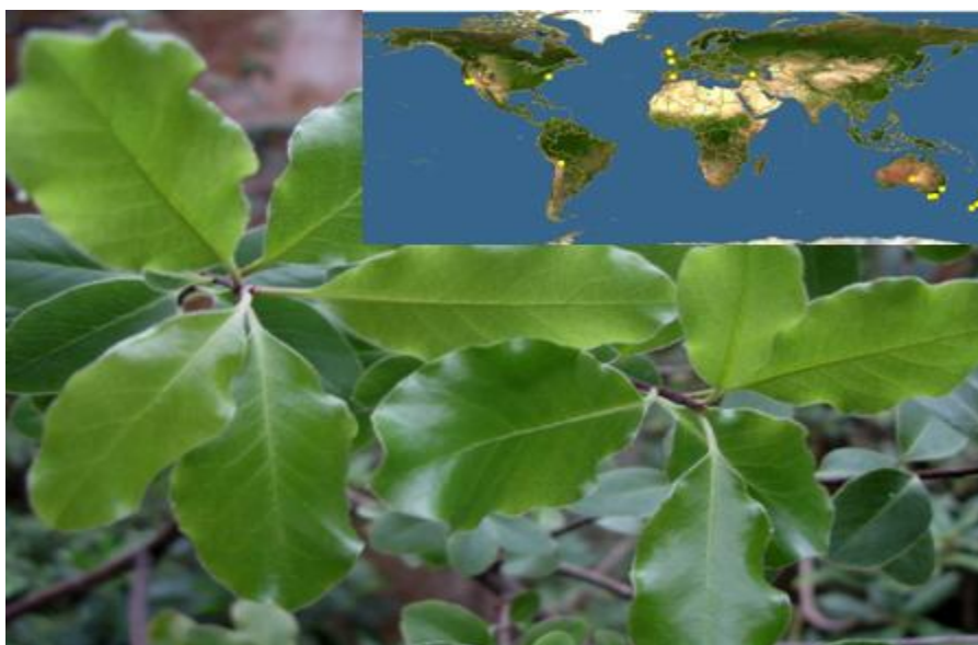
Рис.6. P. tenuifolium (поширення в природі та вигляд в умовах інтродукційного пункту)

P. tenuifolium Gaertn – зростає на морському узбережжі, в гірських лісах, піднімаючись до 900м над рівнем моря, в Новій Зеландії. Поширений також в південній Австралії - Тасманія, Новий Південний Уельс, Вікторія, США - Каліфорнія (Hoskings et al, 2007), Бермуди (Varnham, 2009; EOL, 2013в) – див. рис. 6.