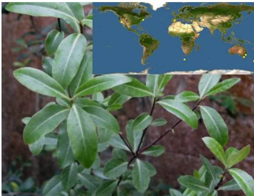
Рис. 8. P. eugenioides (поширення в природі та вигляд в умовах інтродукційного пункту)

P. eugenioides A. Cunn («lemonwood», «тэрата») – в природі це дерево, заввишки до 12м, з сильним лимонним ароматом. В жовтні квітує яскравими привабливими квітками. Він зустрічається по всій території Нової Зеландії (ліси, поля, схили балок, на висоті до 600 м над рівнем моря) (EOL, 2013г) - рис. 8.