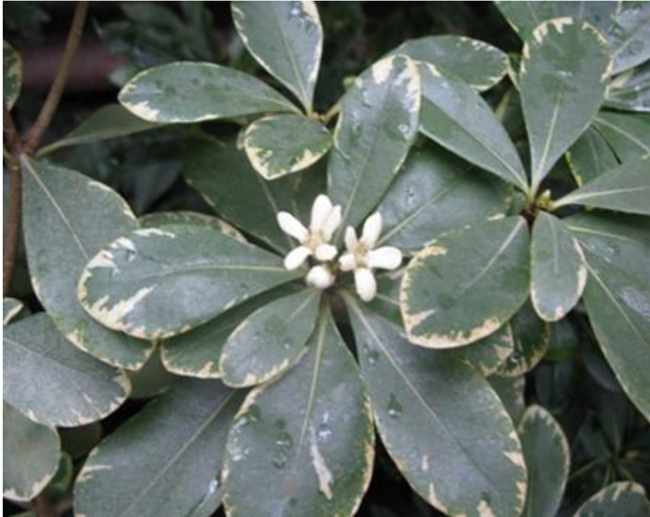
Рис. 4. P. tobira var. variegatum в умовах інтродукційного пункту

листками, вкритими білими плямами. Цвіте з лютого по травень. Квітки кремово-білі, запашні. Річний приріст пагонів становить 4-8 см (рис. 4).