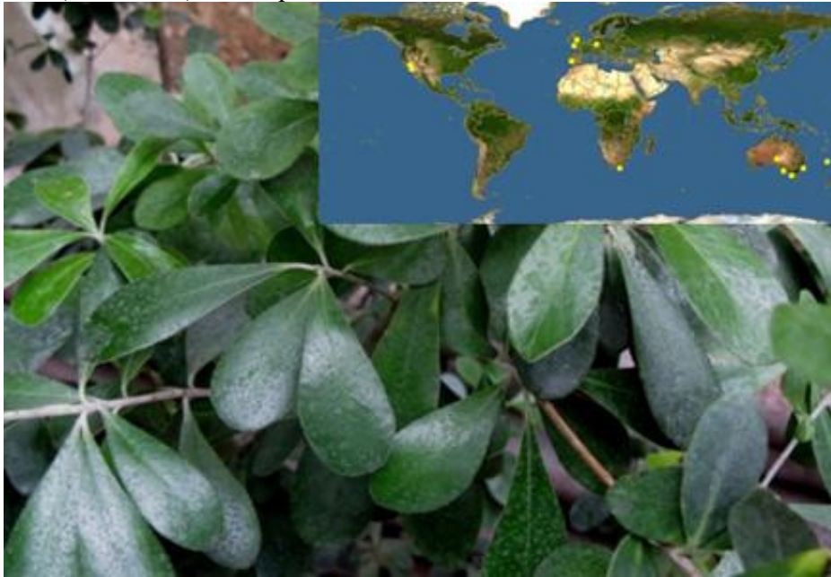
Рис. 7. P. crassifolium (поширення в природі та вигляд в умовах інтродукційного пункту)

P. crassifolium Soland. ex Putterl. – зустрічається на морському узбережжі, у всіх рівнинних та прибережних лісах, особливо у північній частині Нової Зеландії (EOL, 2012) – див. рис. 7.