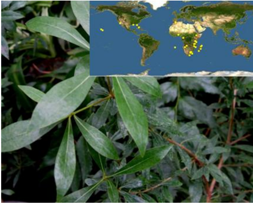
Рис.9. P. viridiflorum (поширення в природі та вигляд в умовах інтродукційного пункту)

Залучено до інтродукції в 2004 році у вигляді живця, отриманого з ботанічного саду ДГУ (м. Дніпропетровськ). В умовах інтродукційного пункту має вигляд розлогого куща, заввишки 50-80 см. Листкова пластинка завдовжки 4-6 см, 0,6-1,5 см завширшки, суцільна, ланцетовидна, з відтягнутою основою та загостреною верхівкою, темно-зелена. Жилкування перисто-сітчасте, центральна жилка прохідна, добре виражена знизу. Черешок короткий. Цвітіння в грудні березні. Квітки зеленувато - білі. Річний приріст пагонів 7-18 см.