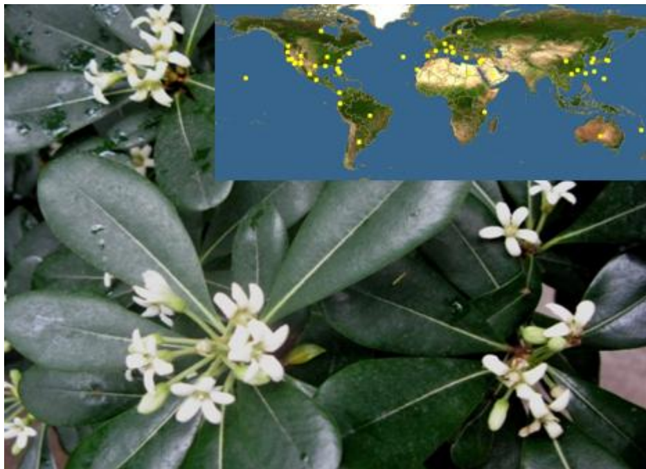
Рис. 3. P. tobira (поширення в природі та вигляд в умовах інтродукційного пункту)

Залучено до інтродукції (живцем) з Донецького ботанічного саду у 1984 році. На сьогодні це густо розгалужене куцоподібне дерево до 3-х метрів заввишки з декоративною плоскою кроною та темними глянцевиими листками. Цвітіння відбувається з лютого по червень. Зонтикоподібне суцвіття нараховує 12–16 трубчастих білих з сильним приємним ароматом квіток. Зав'язує насіння, яке дозріває до кінця зими. Річний приріст пагонів становить 7–15 см (рис. 3).