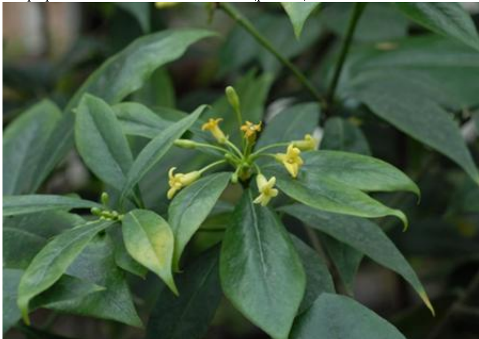
Рис. 10. P. sahnianum в умовах інтродукційного пункту

опушений. Цвітіння відбувається у березні – червні. Квітки жовті, запашні. Річний приріст пагонів становить 7-10 см (рис. 10).