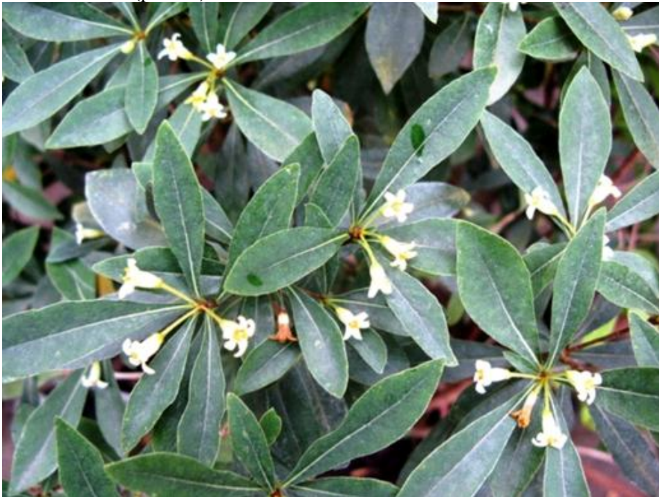
Рис. 2. P. heterophyllum в умовах інтродукційного пункту

P. heterophyllum Franch – інтродукований в 1984 році з живця, отриманого з Донецького ботанічного саду (ДБС). Батьківщина – Західний Китай. Зростає в літньозелених лісах, на сухих кам'янистих місцях, в долинах гірських річок на висоті 1000–4000 м над рівнем моря (Flora of China..., 2012; Chang, Yan, 1974). В умовах інтродукційного пункту це кущоподібне дерево заввишки 4 м, густо вкрите листям. Листки темно-зелені, матові, видовжено-ланцетні. Квітки поодинокі або зібрані в пучки, запахні. Цвітіння відмічаємо в січні квітні, рясне. Зав'язує насіння. Річний приріст пагонів в умовах оранжереї КБС становить 12–20 см (рис. 2).