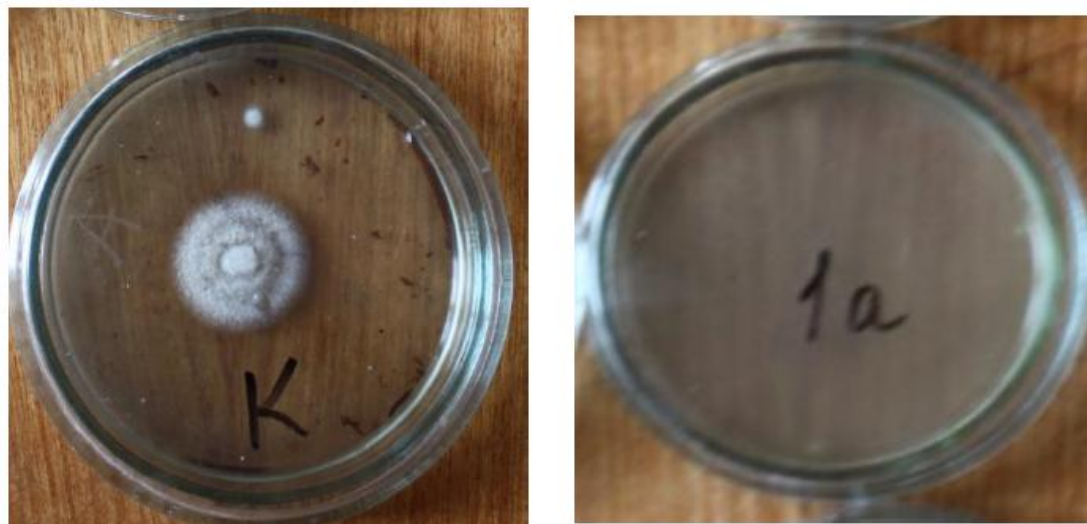
Рис. 2. Фунгіцидна активність водного екстракту Artemisia dracuncululus L. стосовно гриба Fusarium oxysporum при концентрації 100 мг/мл ; К – контроль (експозиція 7 діб).

Основні компоненти ефірної олії полину лікарського - 1,8-цинеол (30,44 %) та камфора (31,92 %), які в значній мірі визначають протимікробні властивості рослини.