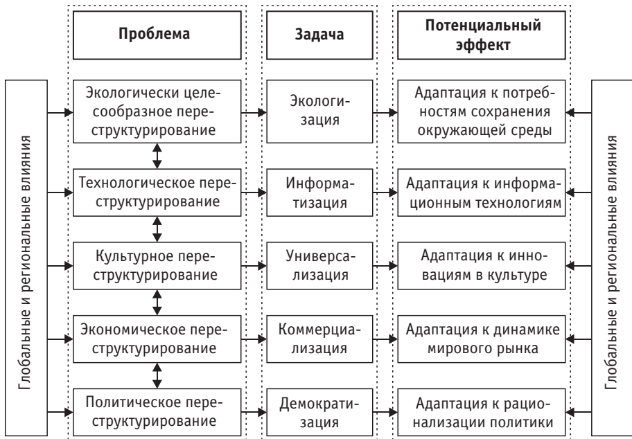
Схема 1. Структурные измерения социетальных трансформаций в Восточной Европе

Взаимосвязанные решения этих задач осуществлялись на национальном уровне не без влияния глобальных и региональных процессов (схема 1).