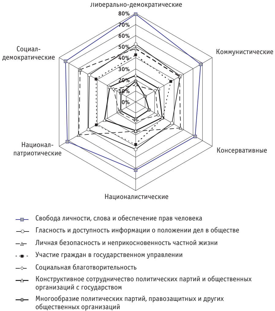
Рис. 2. Значения показателей гражданского общества для каждой группы с определенными политико-идеологическими предпочтениями

В целом подобные взгляды опрошенных продемонстрировали достаточно адекватное понимание сущности гражданского общества, научные определения которого указывают на то, что “это общество, в котором происходит переход основных властных функций от государства к независимым от власти общественным объединениям, способным создать необходимые условия для реализации прав и свобод граждан, самоорганизации личности, реализации