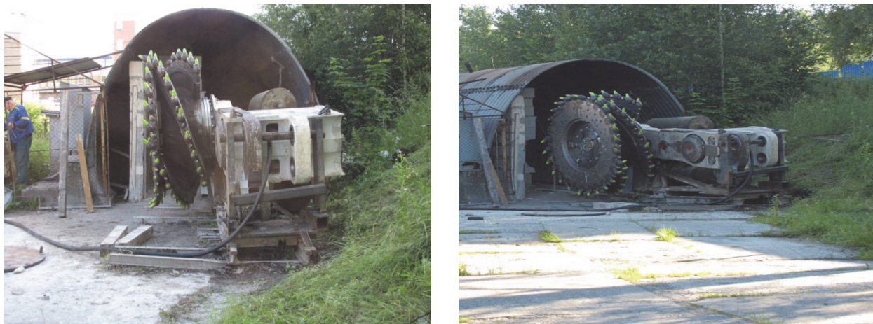
Рис.2. Очистной комбайн при подготовке к проведению испытаний

системах внутреннего пылеподавления применяются сопла с полым сечением конуса либо с конусом сплошного сечения малого диаметра, в системах внешнего пылеподавления используются сопла с конусом сплошного сечения большого диаметра.