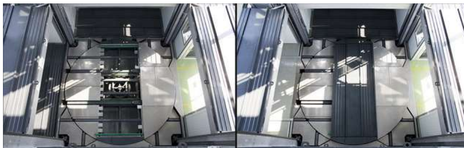
Рис. 2- Зображення платформи підйомно-спускового механізму [5]

Будівництво багатоповерхових гаражів вимагає значних матеріальних затрат. Основним елементом у роботі багатоповерхового паркінгу є платформа підйомно-спускового механізму. Підйом автомобіля здійснюється за допомогою взаємозамінних рухомих палет, що встановлюються на підйомно-спусковий механізм, що складається з прямокутної платформи з обертальною на 360° середньою частиною. Після того як автомобіль завантажується на платформу він піднімається на необхідних поверх паркінгу і переміщується на своє парко місце. Платформа здатна піднімати автомобілі масою до 2700 кг. Розмір машино місця в багатоярусному гаражі повинен бути не менше 2,2x4,6м. У разі, коли використовується прямокутний тип паркування, мінімальна її ширина повинна становити 15 метрів, сюди включається довжина автомобіля, нормативні відступи та ширина проїзду. Для розрахунків беруться розміри «еталонного» автомобіля, зразкові габарити якого: висота – 1,6 м, ширина – 1,7 м, довжина – 4,1 м, радіус повороту – 5,5 м. [5].