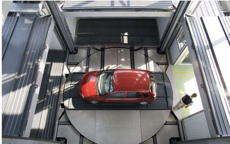
Рис. 3- Платформа підйомно-спускового механізму із завантаженим автомобілем [5]

Необхідною умовою безперебійного функціонування паркінгу є підтримання відповідно температури повітря всередині будівлі і вологості певного рівня. У разі аварійних ситуацій повинна передбачатися можливість швидкого вивантаження автомобілів.