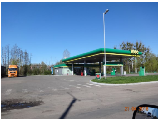
Рис.2. Автозаправний комплекс «WOG» (69 км)

Ринок нафтопродуктів представлено 9 торговими марками. Найбільшу частку, по п'ять АЗК (АЗС), мають мережі «Аветра» і «WOG», по дві- «Укрнафта» та «Укрінтеравтосервіс», по одній- «Укрпетроль», «Аргос», «Амік», «Мавекс» і «Лагуна».