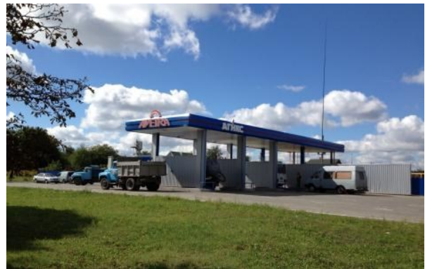
Рис. 3. АГНКС «Аветра» (161 км)