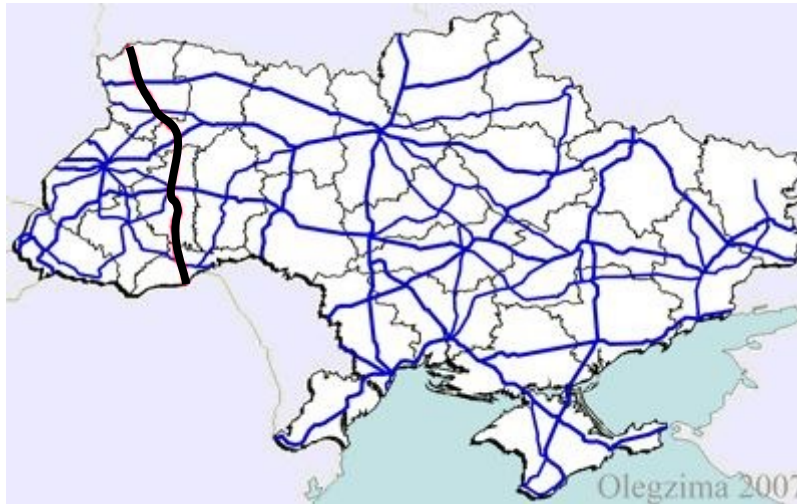
Рис. 1. Автомобільна дорога М19 на території України

Міжнародний автомобільний шлях М-19 (Доманове (на Брест)-Ковель- Чернівці-Тереблече (на Бухарест) (рис. 1.) пролягає через територією Волинської області протяжністю 166,1 км, що складає 32,5% від його загальної довжини, і проходить через два найбільш населених пункти - міста Луцьк і Ковель. Також на ділянці шляху Ковель – Луцьк - Підгайці (на Тернопіль) автомобільна дорога М 19 співпадає з двома національними міжнародними транспортними коридорами МТК Балтійське море - Чорне море та МТК Європа-Кавказ-Азія (ТРАСЕКА) [6].