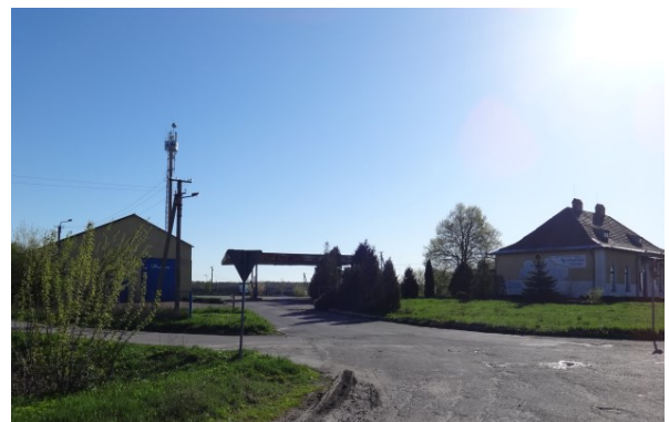
Рис. 5. Пункт автомобільного сервісу «UA Servise» (86км)

Близько 17% складають пункти технічного обслуговування (ТО) транспортних засобів. Серед найбільших можна відмітити «Авто Рома Сервіс» (рис. 4), «UA Servise» (рис. 5), «Автодімсервіс» та ін.