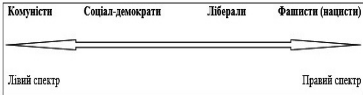
Рис. 1. Право/ліва шкала політичного спектру у контексті типології Й. Жіми (2002, с. 11)

У вельми спрощеному вигляді «спектр політичних течій може бути представлений таким чином: крайні «ліві» (комуністи) – соціалісти – соціал-демократи – ліберали – консерватори (народники, націоналісти) – крайні «праві»» (Здорик, 2009, с. 199). Подібну інтерпретацію право/лівої шкали політичного спектру (див. рис. 1.) подає Й. Жіма (2002, с. 11).