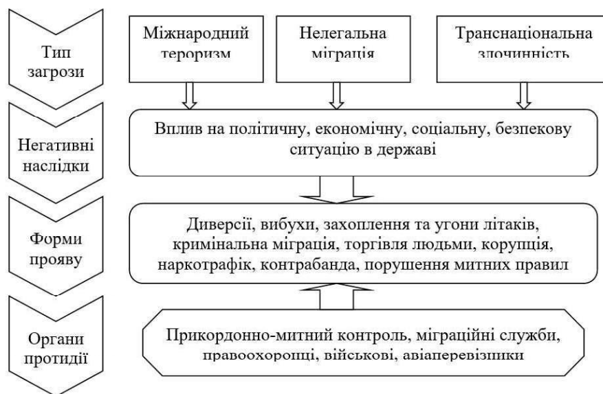
Рис. 2. Характеристика основних загроз, які виникають у результаті використання авіаційного пасажирського транспорту*