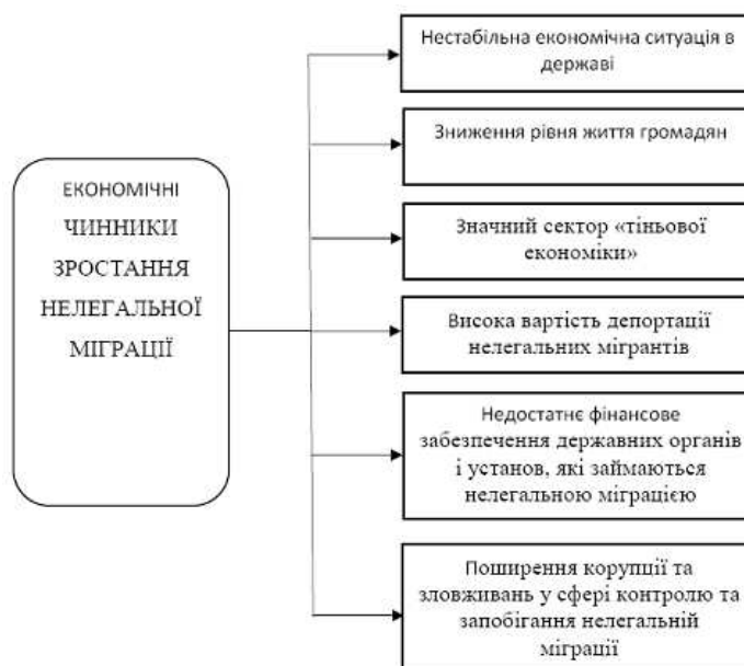
Рис. 3. Економічні чинники, що створюють умови нелегальної міграції

Економічними чинниками зростання нелегальної міграції в Україні виступають: нестабільна економічна ситуація в державі, зниження рівня життя громадян, яке супроводжується безробіттям, невилплатою зарплатні, позбавленням соціальних пільг, утворення соціальної основи детермінації злочинів, пов'язаних із задоволенням природних життєвих потреб населення. Нелегальна міграція як форма організованої злочинності посідає одне з перших місць за прибутковістю, створює значний сектор «тіньової економіки», масове прибуття мігрантів значно погіршує умови життя корінного населення, загострює соціальні конфлікти між місцевими жителями і приїжджими, слабке матеріальне забезпечення державних органів і установ, які займаються нелегальною міграцією, висока вартість депортації нелегальних мігрантів (депортація одного нелегального мігранта з України коштує близько 1000 доларів США), поширення корупції та зловживань у сфері контролю та запобігання нелегальній міграції, корупційні дії посадовців щодо приховування нелегальних мігрантів, їх легалізації, безпосереднє прикриття злочинних угруповань, які займаються контрабандою людей, наявність суперечностей, коли на фоні збільшення кількості заможних і багатих людей, зростання їхніх прибутків багато державних службовців, наділених повноваженнями у забезпеченні охорони кордону, не мають навіть помірному достатку (див.рис.3).