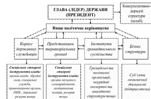
Рис. 3. Принципова схема реалізації місії держави (сучасне уявлення)

У контексті викладеного вище, роль органів державної влади та органів місцевого самоврядування в процесі вирішення питань щодо забезпечення безпеки полягає у визначенні засобів і способів задоволення потреб у безпеці соціальних суб'єктів, а визначатися ці потреби повинні в результаті широкої громадської дискусії та залученням представників бізнес структур (рис.3).