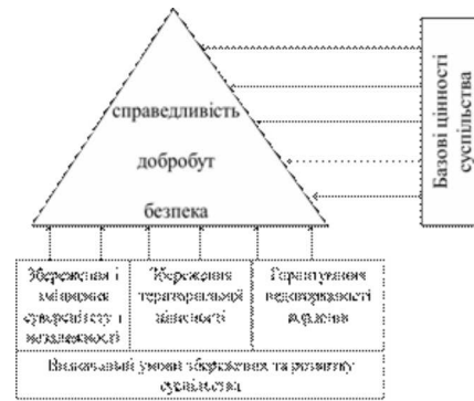
Рис. 1. Цінності суспільства та визначальні умови їх збереження та розвитку

Кожна група включає низку цінностей, збереження та розвиток яких є фундаментальною умовою виживання суспільства та держави, а відтак спонукають їх до відповідних дій. Так, прагнення до справедливості було лейтмотивом боротьби суспільства з тиранією впродовж останніх століть в європейських країнах, що знайшло своє відображення у їх законодавстві (права і свободи людини, право на приватну власність та особисте життя тощо). При цьому, саме безпека є не тільки цінністю, від наявності якої залежить виживання нації, а й передумовою збереження інших цінностей. З огляду на це головним пріоритетом державної політики будь-якої країни є забезпечення безпеки, що досягається перш за все за рахунок: збереження і зміцнення суверенітету і незалежності; збереження територіальної цілісності; гарантування недоторканості державних кордонів (Рис. 1). Тому виконання цих завдань можна розглядати як визначальні чинники виживання суспільства, його добробуту та прогресивного розвитку, а якість, системність та оперативність їх виконання визначають сутність, сенс існування та місію держави, а саме: забезпечення безпеки суспільства та людини (Рис. 2).