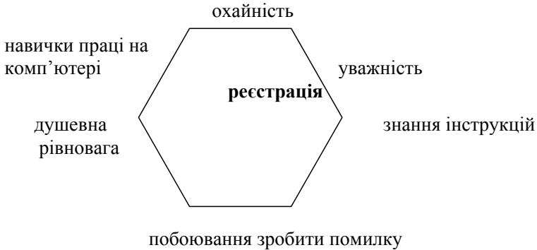
Мал. 1. Шестипозиційна замкнута модель соціальних комунікацій в системі «реєстрація документів»

Стосовно цього переліку шестипозиційна модель соціальних комунікацій системи «реєстрація документів»: