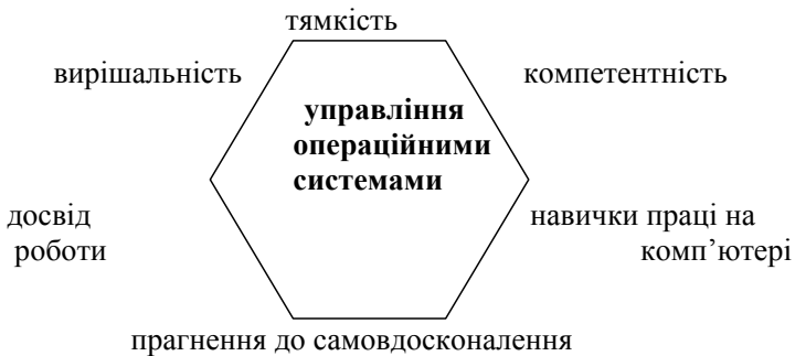
Мал. 3. Шестипозиційна замкнута модель соціальних комунікацій в системі «управління операційними системами і складання баз даних»

Стосовно цього переліку шестипозиційна модель соціальних комунікацій в системі «управління операційними системами і складання баз даних» має вигляд: