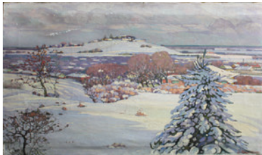
Рис. 4.6. Соломон Аронович Розенбаум. Зимовий день. 1930-ті рр., полотно, олія. Національний художній музей України.

Fig. 4.5. Abram Anselovich Manevich. Birch trees. 1911, oil on canvas.