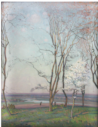
Рис. 4.8. Соломон Аронович Розенбаум. Весняний пейзаж. 1937, полотно, олія. Національний художній музей України.

«Весняний пейзаж» (1937, полотно, олія) (Рис. 4.8), Полтавського художнього музею (галерея мистецтв) ім. М. Ярошенка «Вулиця у Полтаві» (1920, полотно, олія) (Рис. 4.9).