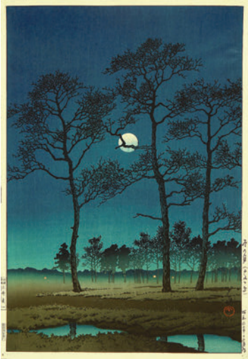
Рис. 4.4. Хасуі Кавасе (Hasui Kawase; 1883–1957). Пейзаж. Японія. Папір, кольорова ксилографія.

ливим психологізмом. Як приклад, зазначимо відомі пейзажі С. Розенбаума зі збірки Національного художнього музею України – «Зимовий день» (напевно 1930-ті роки, полотно, олія) (Рис. 4.6; 4.7),