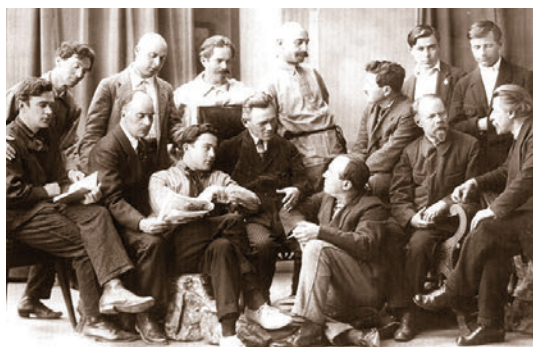
Рис. 4.2. Художники – члени Полтавської філії АХРР. Фото. 1926.

Починаючи з 1915 року, С. Розенбаум бере активну участь у художніх виставках, але основна його творча діяльність припадає на радянський час. 1926 року він демонструє свої твори на виставці картин Полтавської філії АХРР 1 (Рис. 4.2), а з 1927 р. і до 1941 р. стає постійним експонентом АХЧУ 2 , обласних та республіканських виставок.