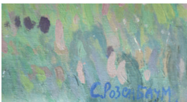
Fig 4.7. Signature of Solomon Aronovich Rosenbaum.