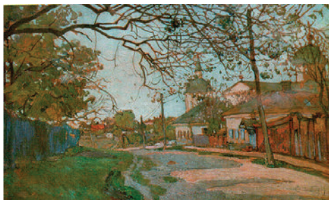
Рис. 4.9. Соломон Аронович Розенбаум. Вулиця у Полтаві. 1920. Полотно, олія. Полтавський художній музей (галерея мистецтв) ім. М. Ярошенка.

Fig. 4.8. Solomon Aronovich Rosenbaum. Spring landscape. 1937, oil on canvas. National Art Museum of Ukraine.