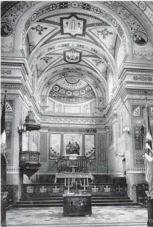
Середина відновленої церкви Пресвятої Трійці в Дрогобичі. Фото Б. Лібермана, 1907 р.

Цікава поштівка-пам'ятка 1907 р. “Середина відновленої церкви Пресвятої Трійці в Дрогобичі”, видана для збору коштів на завершення оздоблення храму. На ній задокументовано частково оформлений інтер'єр церкви до встановлення іконостасу у 1930-х рр.