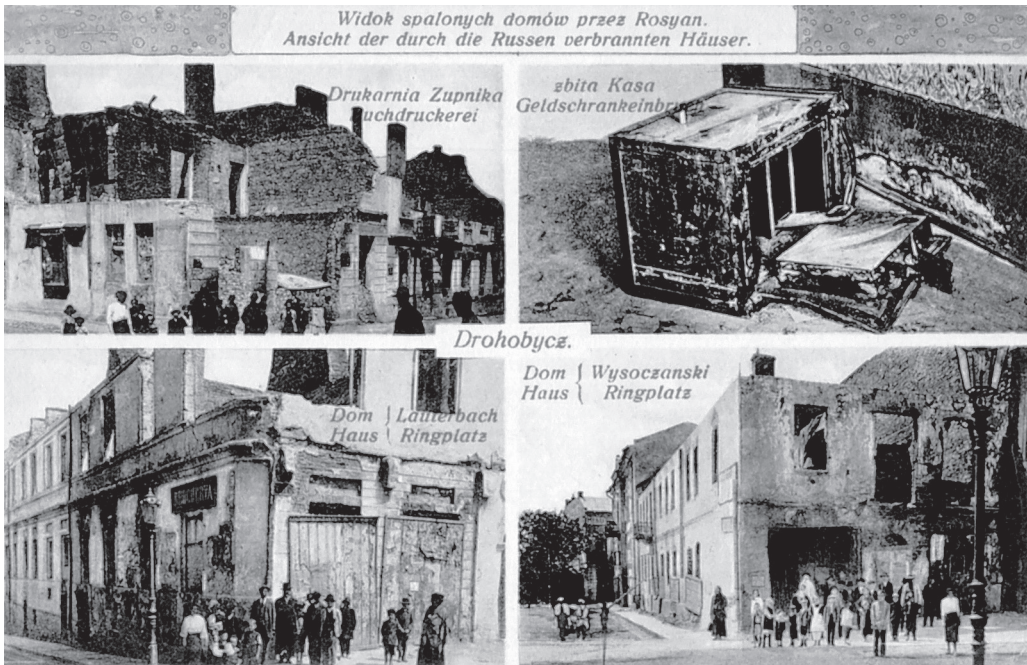
Вид спалених росіянами будівель Дрогобича. Видавництво книгарні Я. Пільпля в Дрогобичі, 1916 р.

розраховані на велику цільову аудиторію учнів та студентів, котрі відправляли їх додому.