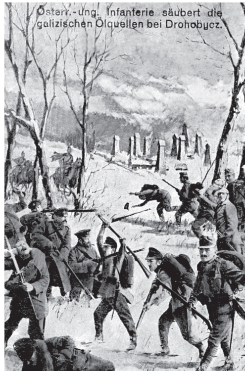
Австро-угорська піхота звільняє галицькі нафтові свердловини біля Дрогобича, 1915 р.

Були і державні замовлення на поштівки. До таких найімовірніше належать “Вид спалених росіянами будівель. Дрогобич” та “Австро-угорська піхота звільняє галицькі нафтові свердловини біля Дрогобича”, видані у Дрогобичі та Відні у 1915 р. після того, як австрійські війська, до складу яких входили Українські Січові Стрільці, відвоювали Галичину у росіян. Перша документує руйнації та спустошення, яких зазнав Дрогобич від російських військ у період окупації міста під час Першої світової війни (1914–1918). Нищилися приватні будинки, крамниці, друкарні, освітні заклади. Друга цікава технічним виконанням, виготовлена за допомогою фотоколажу. Для цього фотограф відзняв постановочну “театральну” сцену, після чого контурну фігуративну композицію наклав на рисунок краєвиду та розфарбував.