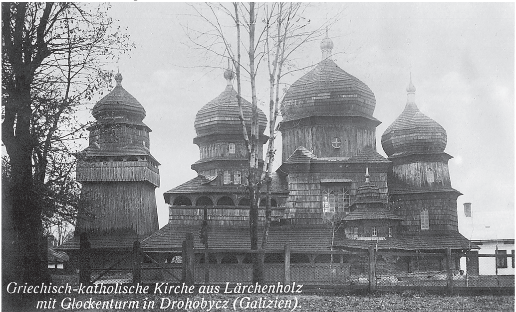
Griechisch-katholische Kirche aus Lärchenholz mit Glockenturm in Drohobycz (Galizien).

Оскільки Дрогобич – місто переплетіння різних культур – української, польської та єврейської, – то не дивно, що вони знайшли своє відображення на поштівках. На них бачимо церкви Св. Юра та Воздвиження Чесного Хреста, костел ап. Варфоломея та Діви Марії, Хоральну та Прогресивну синагоги.