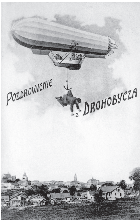
Вітання з Дрогобича. Загальний вид. Видавництво книгарні Я. Пільпля в Дрогобичі, 1910-ті рр.

Зображення міських краєвидів є найпопулярнішою темою старих поштових листівок. Кожне місто, що вважалося розвиненим культурно-економічним центром, репрезентували десятками, а то й сотнями їхніх різновидів. Такі поштівки дрогобичани та приїжджі розсилали своїм родичам, друзям, коханим – як “Вітання з Дрогобича”. Цікавою у цьому плані є поштівка 1910-х рр. видавництва книгарні