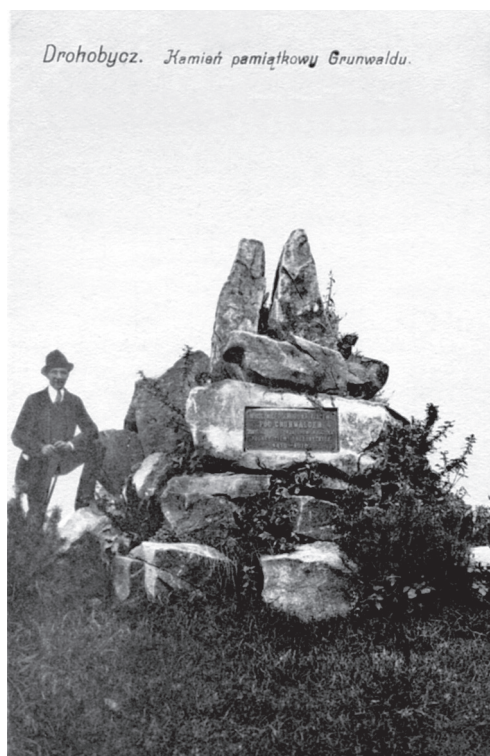
Пам'ятний камінь Грюнвальду. Видавництво Л. Розеншайна в Дрогобичі, 1913 р.

Комплекти поштівок, з яких можна було скласти збірний образ міста, були популярними на початку ХХ ст. Це зображення найвизначніших міських об'єктів (головних вулиць, урядових споруд, палаців, храмів, пам'ятників). Збереглися поштівки схожого стибу, що представляють Львів, Стрий, Самбір, тощо. Найцікавішими дизайнерськими зразками є поштівки із вклеєним всередину буклетом-гармошкою, що включав у себе від восьми