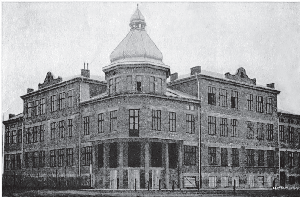
Памятка з посвячення будинку української гімназії Рідної Школи в Дрогобичі. - 9. VI. 1930. Українська гімназія (нині СШ №1 на вул. П. Сагайдачного). Накладом української гімназії Рідної Школи в Дрогобичі. Друк Я. Левенкофа, 1930 р.