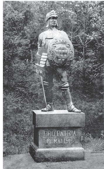
Лицар в збруї для міста Дрогобича і повіту, 1916 р.