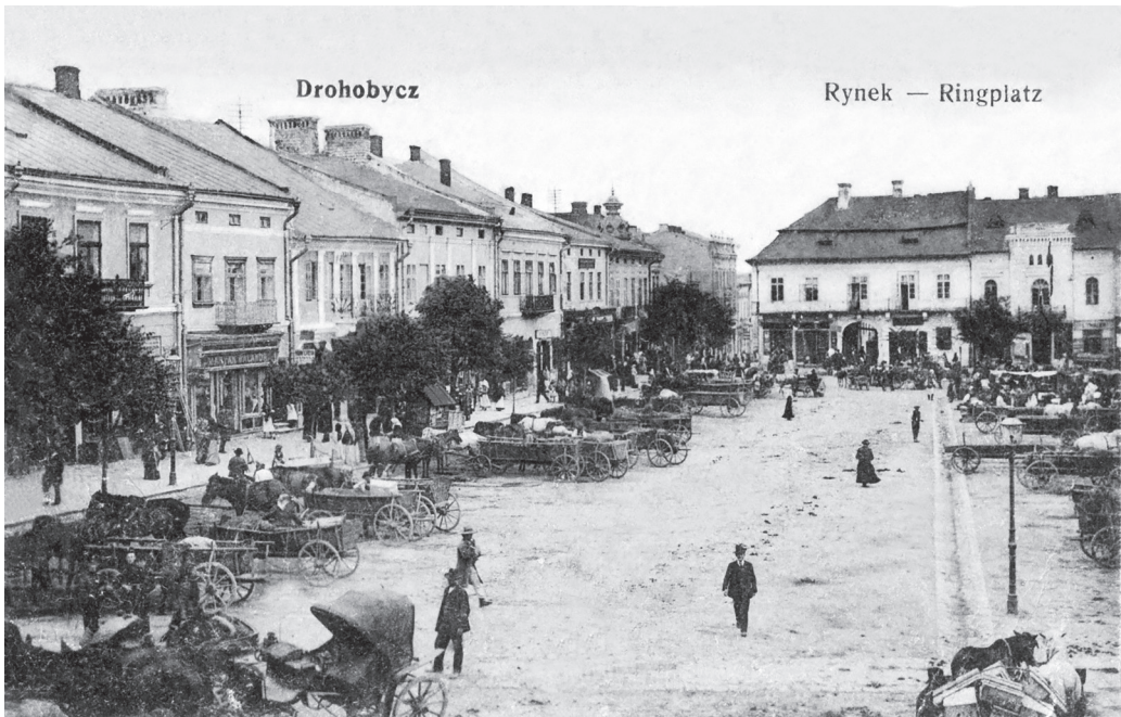
Площа Ринок. Видавництво Л. Розеншайна в Дрогобичі, 1917 р.

до десяти різноманітних зображень. Буклет вклеювався у двошарову поштівку, верхній лист якої був із прорізним віконечком спеціально для вкладки.