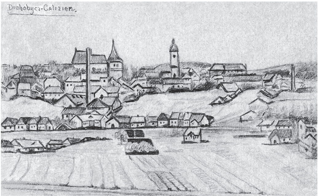
Загальний вид. Малюнок олівцем на листівці Червоного Хреста, 1914 р.

Від кінця XIX ст. почав набувати поширення кольоровий друк за допомогою техніки шовкографії. Для кольорової поштівки зазвичай використовували чорно-білу фотографію, яку розмальовували вручну аніліновими фарбами, після чого з неї готували кліше для друку.