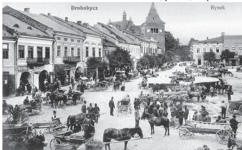
Площа Ринок. Видавництво Л. Розеншайна в Дрогобичі, 1912 р.