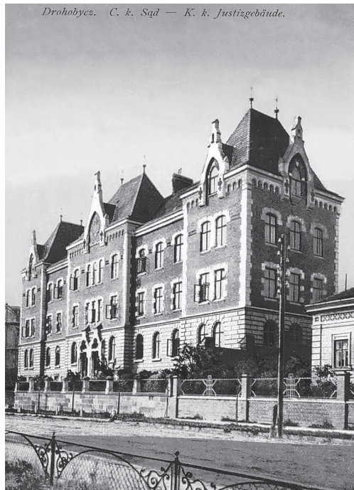
Міський суд. Видавництво книгарні Я. Пільпля в Дрогобичі, 1910-ті рр.

Найбільшою у Дрогобичі вважалася державна гімназія ім. Франца-Йосифа I, згодом гімназія ім. короля Володислава Ягайла, нині – Дрогобицький державний педагогічний університет ім. Івана