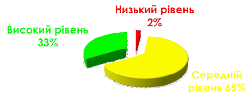
Рис. 2. Показники розвитку духовного потенціалу педагогів

Для емпіричного дослідження психологічної готовності педагогів до розвитку духовного потенціалу учнів було складено комплекс з 16 психодіагностичних методик. Узагальнені діагностичні дані щодо розвитку духовного потенціалу педагогів (рис. 2) і учнів (рис. 3) подано нижче.