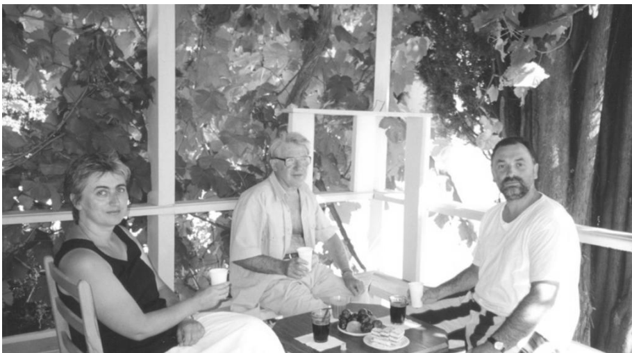
Серпень 1998 р., м. Севастополь, Міжнародна школа церковної архітектури

За такою схемою, але у своєму аспекті, потрібно говорити тією ж мовою, що і живі класики. Навести їх.