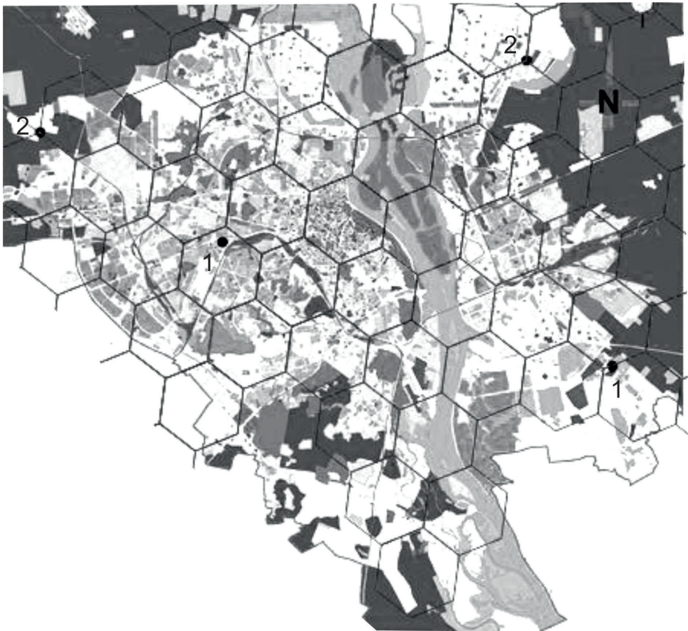
Рис. 1. Схема розміщення установ слідчих ізоляторів і виправних центрів у м. Києві на основі гексагональної решітки: 1 – існуючі заклади, 2 – перспективні заклади

Аналіз ситуації, що склалася навколо Лук'янівського СІЗО, тенденцій розвитку пенітенціарної системи, а також напрямів та динаміки розвитку міста Києва дозволяє передбачити поступовий перехід від моноцентричного до поліцентричного компактно-розосередженого розміщення установ карно-виконавчої служби, до міської та обласної мережі увійдуть як суди і слідчі ізолятори, так і пенітенціарні заклади різного ступеня безпеки для різних категорій засуджених. Першим кроком на цьому шляху можуть стати розвантаження комплексу Лук'янівського