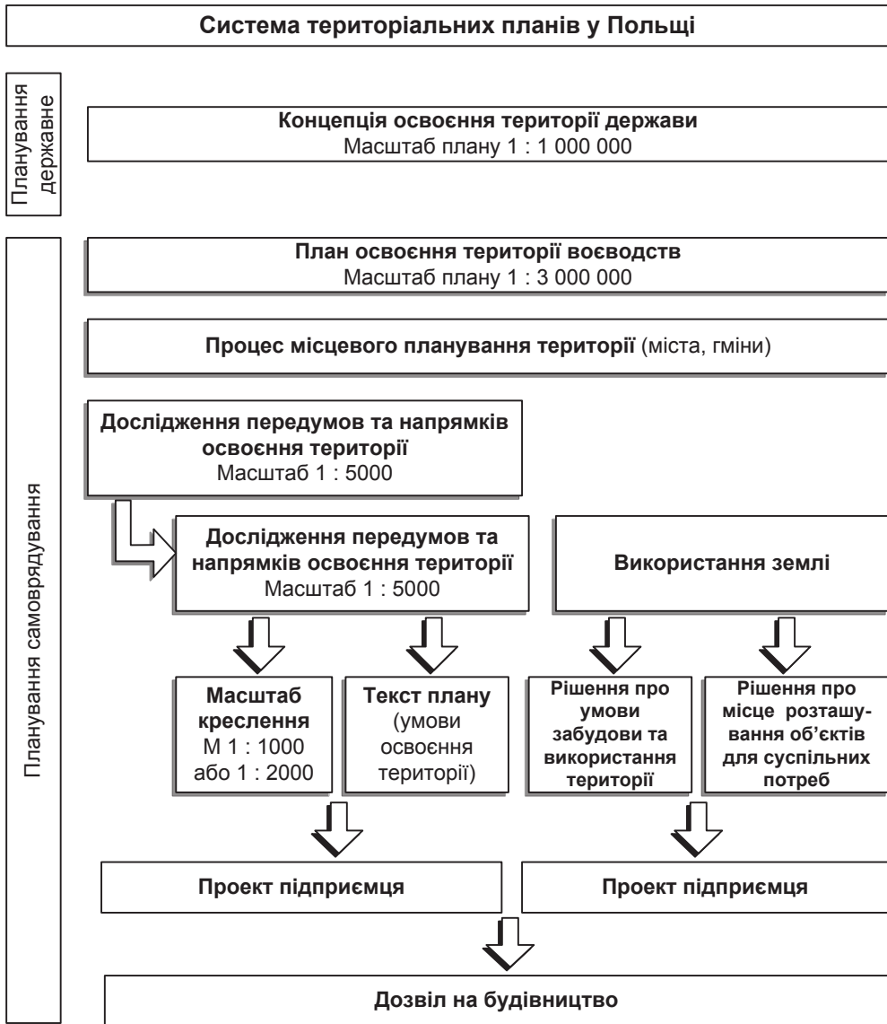
Рис. 2. Система територіального планування Польщі з урахуванням місцевого планування території

окремих осіб в системі апарату гміни і обов'язково проводяться для території гміни в цілому.