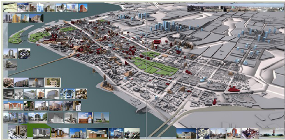
Рис. 3. Концепция застройки центральной части Днепропетровска

Рекомендации по застройке центральной части города отражены в развёртках, а также на трёхмерной модели города (рис. 3).