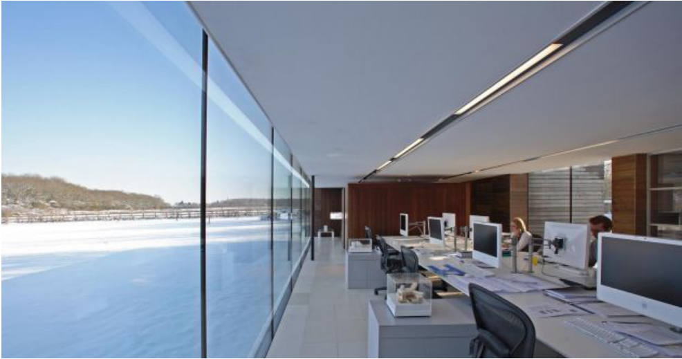
Фото 2. Архітектурне бюро «Nicolas Tye Architects», в 70 кілометрах від Лондона у сільській місцевості [2]

допомогою Інтернету. Сьогодні у Львівській області відомі випадки розташування офісів окремих приватних фірм у приміській зоні, а також у сільській місцевості. Досить часто розміщуються вони у колишніх житлових будинках, які були викуплені, або орендовані під дану функцію. На цей крок власників фірм спонукали непомірно високі ціни оренди офісних приміщень у місті, проблеми із паркуванням, експлуатаційні витрати, тощо. Щоправда це за собою потягнуло маятникову міграцію окремих працівників. Але, вочевидь, це первісний етап. Чому не можна припустити (зрештою на сьогодні вже є такі випадки), коли у майбутньому ці працівники осядуть тут, у селі, поблизу місць праці, в екологічно чистій зоні, на своїй земельній ділянці, у своєму власному будинку. У будинку, який в енергетичну кризу, із постійно зростаючою вартістю на енергоносії, стає ще більш привабливим, аніж квартира у місті.