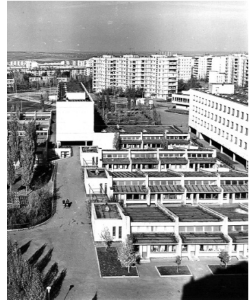
Рис. 3. Шкільний комплекс із двох автономних шкіл на 30 класів кожна у м. Луганську, арх. Й. Каракіс, Н. Савченко, В. Волік та ін.

гогів, у цілому працівники народної освіти і гігієнічні служби не підтримали ідею укрупнення. Великі школи при традиційній структурі виявилися важко керованими, оскільки в них передбачалися в основному ті ж штати адміністративного та обслуговуючого персоналу, що і в звичайних школах. Це створювало об'єктивні складності для раціональної організації навчально-виховного процесу. Для вирішення проблеми удосконалення мережі шкіл в укрупнених мікрорайонах архітектори запропонували компромісний шлях — створення кооперованих шкільних комплексів, що об'єднують 2–3 порівняно невеликих автономних навчальних заклади.