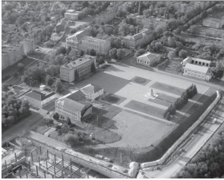
Центральна площа