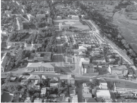
Центр міста