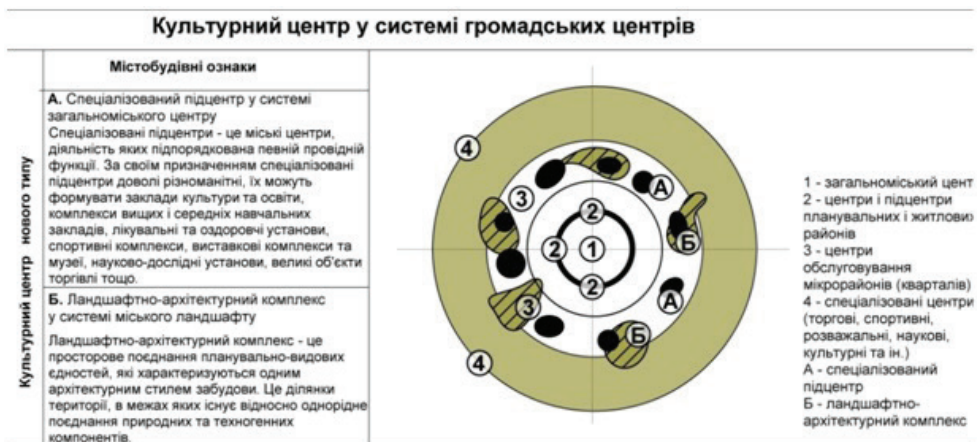
Рис. 2. Культурні центри у системі загальноміського центру Львова

Містобудівна концепція формування «простору культури» (культурного осередку нового типу) була опрацьована в межах ділянки, розташованої східніше стадіону між вулицею Хуторівка і кільцевою автодорогою та долиною річки Зубра згідно з детальним планом території, виконаним Містопроєктом у 2008 р. [6]. Ця територія характерна відповідними умовами транспортної доступності як зі Львова, так і з інших