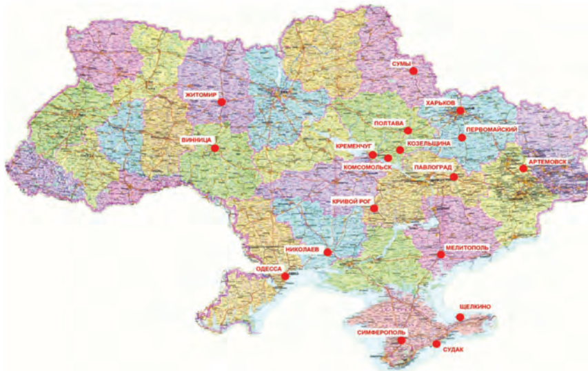
Рис. 1. Міста, в яких інститут виконував планувальні роботи в 2002–2014 рр.

Проектний та науково-дослідний інститут «Харківський Промбуд-НДІпроект» – базова, територіальна проектна організація Держбуду України, а потім Міністерства регіонального розвитку України, автор схем формування і розвитку промислових формувань (промвузлів – Роганського харчового промвузла, комплексу базисних складів у смт Васищево, Першотравневого, Конотопського, Затуринського, Куряжського, Кролівецького; промрайонів – Іванівського, Орджонікідзевського, Баварського, Диканівського, Фрунзенського м. Харкова, Північного, Південного м. Суми та інших промислових районів і вузлів Харківської, Полтавської і Сумської областей) (рис. 1).