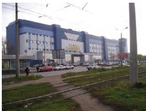
Рис. 5. Реновація цеху заводу «Кондиціонер» по пр. Московському, 257, та Взуттєвої фабрики по вул. Ак. Павлова, 120, під торговельний центр

Залежно від розташування об'єктів у промутворенні можливе використання будівель, об'єктів або площадки в цілому;