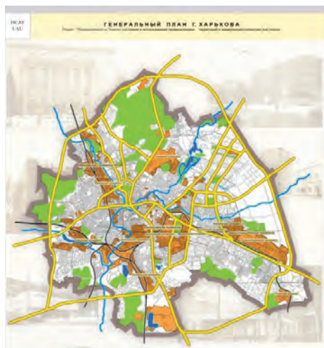
Рис. 3. Генеральний план м. Харків 2004 р. Розділ «Аналіз стану та використання промислових та комунально-складських територій міста»