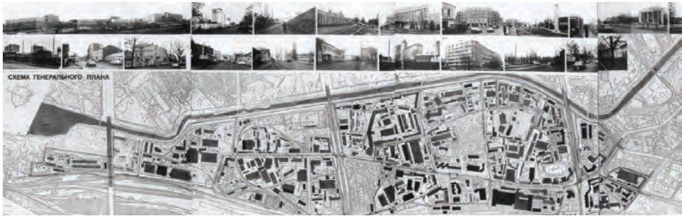
Рис. 2. Схема розвитку Іванівського промислового району м. Харкова

ну Південно-Салтівського промвузла», «Схема розвитку Пилиповського промвузла», «Схема розвитку групи підприємств по ул. Достоевського», «Схема розвитку групи підприємств по вул. Довголевського» та ін.; – зміни в структурі промислових територій, їх функціональному використанні. Частина підприємств зупинили своє існування. На вільних територіях, а також на невикористаних промислових територіях діючих підприємств на різних умовах землекористування розташовувалися малі підприємства, склади, бази та інші структури;