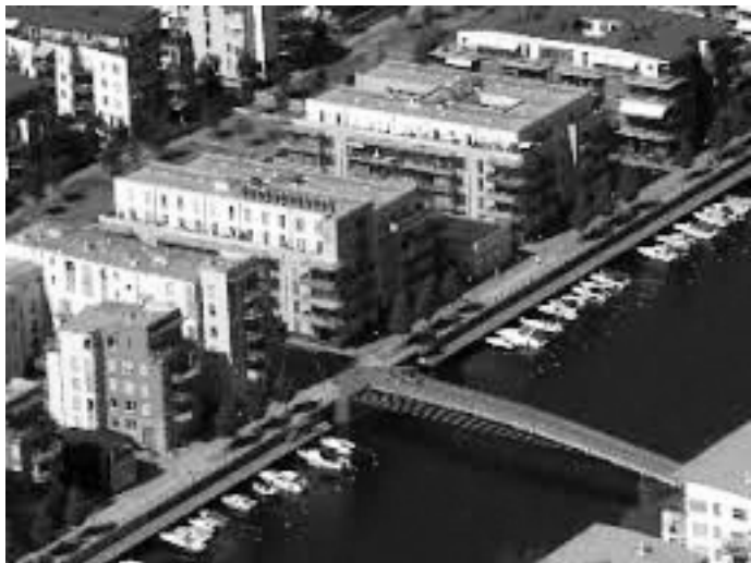
Рис. 8. . Фрагменти району Хаммарбю Шёстад

У районі планується створити потужний міський