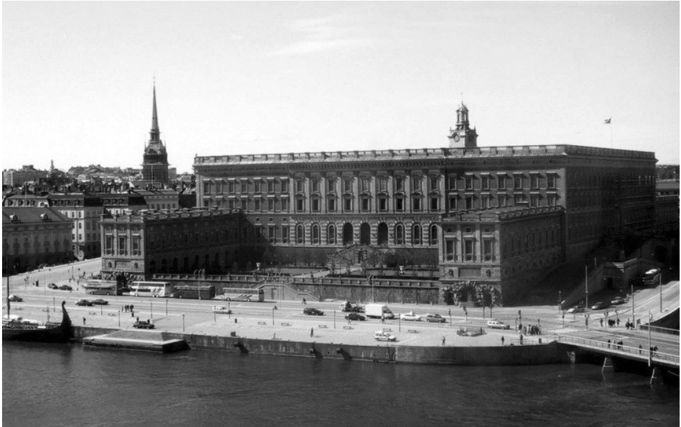
Рис. 3. Королівський палац (Kungliga slottet)