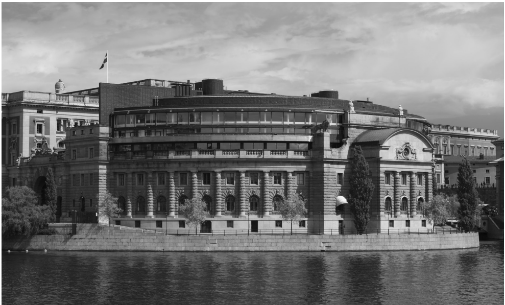
Рис. 4. Риксдаг – Шведський парламент (Sveriges riksdag)

Планування в Швеції, яке часто називають фізичним плануванням, має тривалу історію. Перший закон про планування був прийнятий у ХІХ сторіччі. Здійснюється планування переважно місцевими органами влади, хоча держава також залучена до цього процесу.