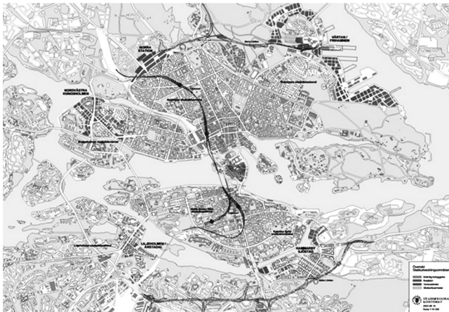
Рис. 6. Стратегія розвитку Стокгольма (план точкового девелопменту).

Хаммарбю Шёстад додає нове «кільце розвитку» в планувальній структурі Стокгольма. Це сучасний, напіввідкритий, район міста, який