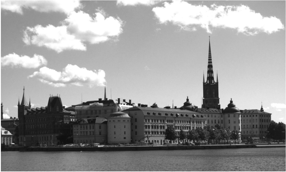
Рис.1. Стокгольм. Вид на Ріддархолмен (Рицарський острів). На передньому плані башта ярла Біргера, будинок Старого аукціону та палац Врангеля, на задньому плані – дзвіниця церкви Ріддархолмчюрка.

– XV ст. важливу роль у розвитку Стокгольма відігравали німці, які складали чверть населення і майже половину членів магістрату. Тільки в кінці XV ст. шведам вдалося повернути собі ключові позиції в управлінні містом (рис. 1).