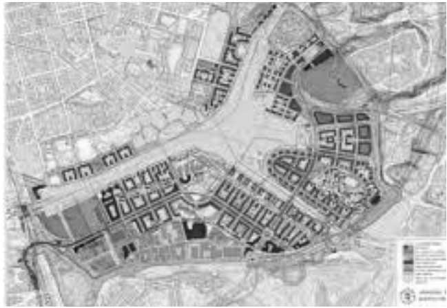
Рис. 7. Детальний план розвитку Хаммарбю Шёстад

Хаммарбю Шёстад є найбільшим проектом міського розвитку Стокгольма з екологічною програмою, яка включає подачу енергії, очищення води, використання зворотних вод та утилізацію відходів. Район має власну екологічну програму, яка сфокусована на питанні навколишнього середовища як на етапах планування,