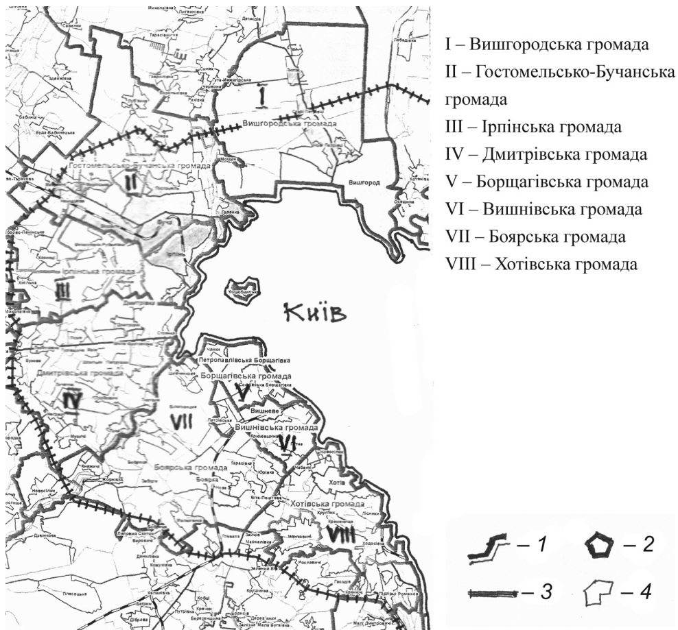
Рис. 3. Варіант формування територіальних громад у західній частині при- міської зони м. Києва: 1 – межа міста Києва; 2 – межі територіальних громад; 3 – перспективна кільцева автодорога; 4 – населені пункти

Хотів, Чабани, Новосілки, Лісники, Круглик, Кременище, Ходосів- ка, Іванковичі, Підгірці-Романків.