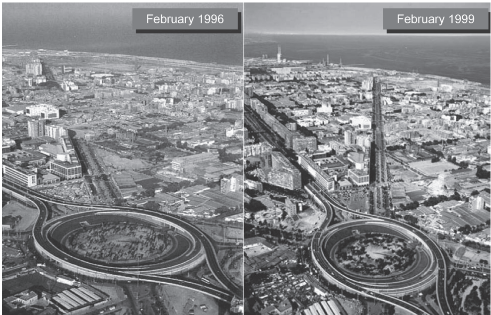
Рис. 5. Стратегія планування приморських територій міста (1986–1992 рр.): А – до реконструкції; Б – після реконструкції