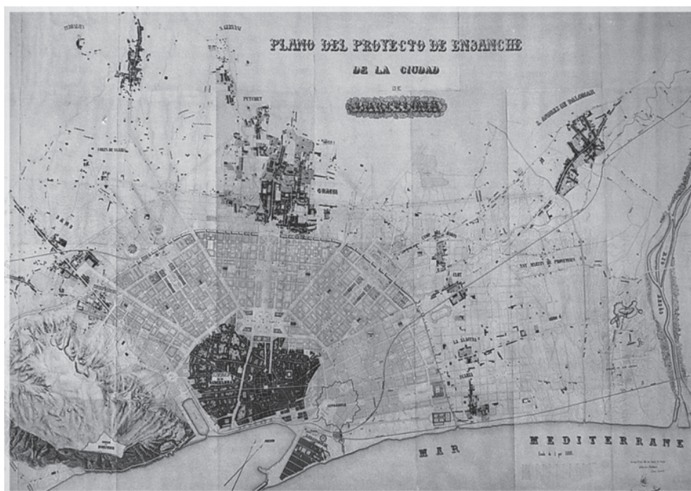
Рис. 2. План розширення міста (за А. Ровіра (1855 р.))