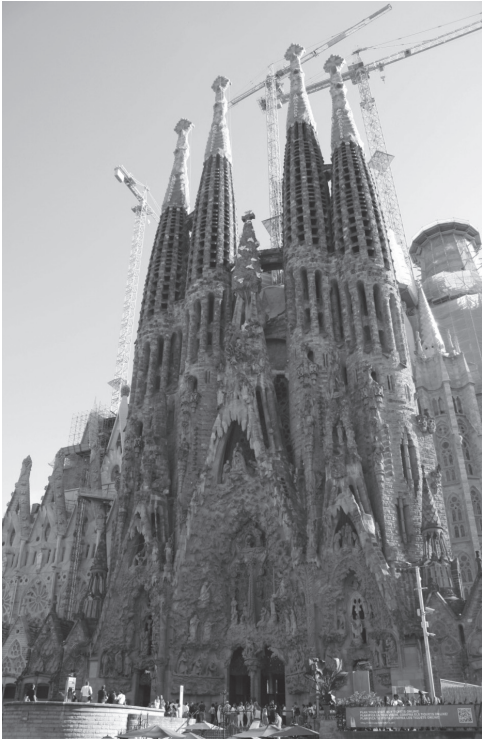
Рис. 4. Знакова споруда Барселони – собор Саграда Фамілья (арх. А. Гауді)

Стратегія просторового розвитку міста здійснювалася на основі матеріалів генерального плану. Так, наприклад, перебудова окремих планувальних районів відбувалась у процесі підготовки до Олімпійських ігор 1992 року зі створенням так званого Олімпійського кільця, сформованого спортивними спорудами. Здійснювалася «розчистка» приморських територій (1989–1992 рр.) у межах міста від промислово-комунальних об'єктів (рис. 5), а також при реконструкції транспортної магістралі Діагональ (1996–1999 рр.) (рис. 6). Значні