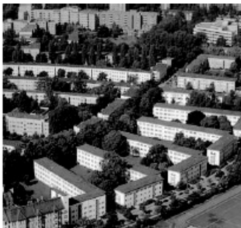
Рис. 7. Традиційна блочна забудова в районі Райніккендорф, «Біле місто» (W2)

Темпельхоф-Шьонеберг, Штеглиц-Целендорф) у період 50–70-х років ХХ ст., а також частково представлені на периферії в інших районах. Прикладом такої забудови з вкрапленнями ландшафтних форм може бути район Любарц (рис. 8). КПП становить 0,5–0,8; КОП – 0,15–0,2.