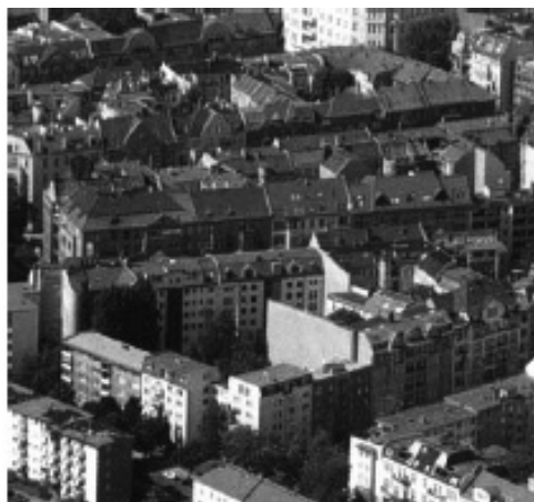
Рис. 6. Традиційна блочна забудова у районі Шьонеберг (W1)