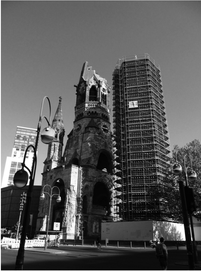
Рис. 2. Берлін. Меморіальна церква кайзера Вільгельма (Gedächtniskirche) (арх. Франц Швехтен, 1891–1895 рр.). Справа – сучасна дзвіниця (арх. Егон Айерман, 1963 р.).

і Берлін. Міські права Кельна (який формувався на острові посеред Шпреє) вперше згадуються в 1237 році, а міські права Берліна (містився на північному березі Шпреє) – в 1244 році. У 1307 році обидва міста об'єдналися і заснували спільну ратушу.