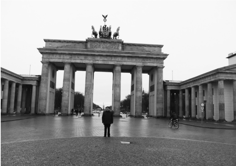
Рис. 1. Берлін. Бранденбурзькі ворота – символ Берліна і Німеччини (арх. Карл Готтгард Лангганс, 1788–1791 рр.).

Берлін – всесвітньовідомий освітній, культурний та науковий центр. У місті функціонують 4 значних університети: Берлінський університет імені Гумбольдта, Берлінський технічний університет, Вільний університет Берліна та Берлінський університет мистецтв.