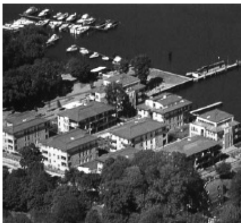
Рис. 8. Житлова забудова з ландшафтною формою на окраїні району Любарц (W3)

Житлова територія W4 з ландшафтною формою – це розтягнута відкрита забудова з односімейними окремо розміщеними або спареними будинками на периферії міста (рис. 9). КПП становить 0,25; КОП – 0,15; щільність квартир – 15 квартир/га; щільність населення – 40 мешканців/га.