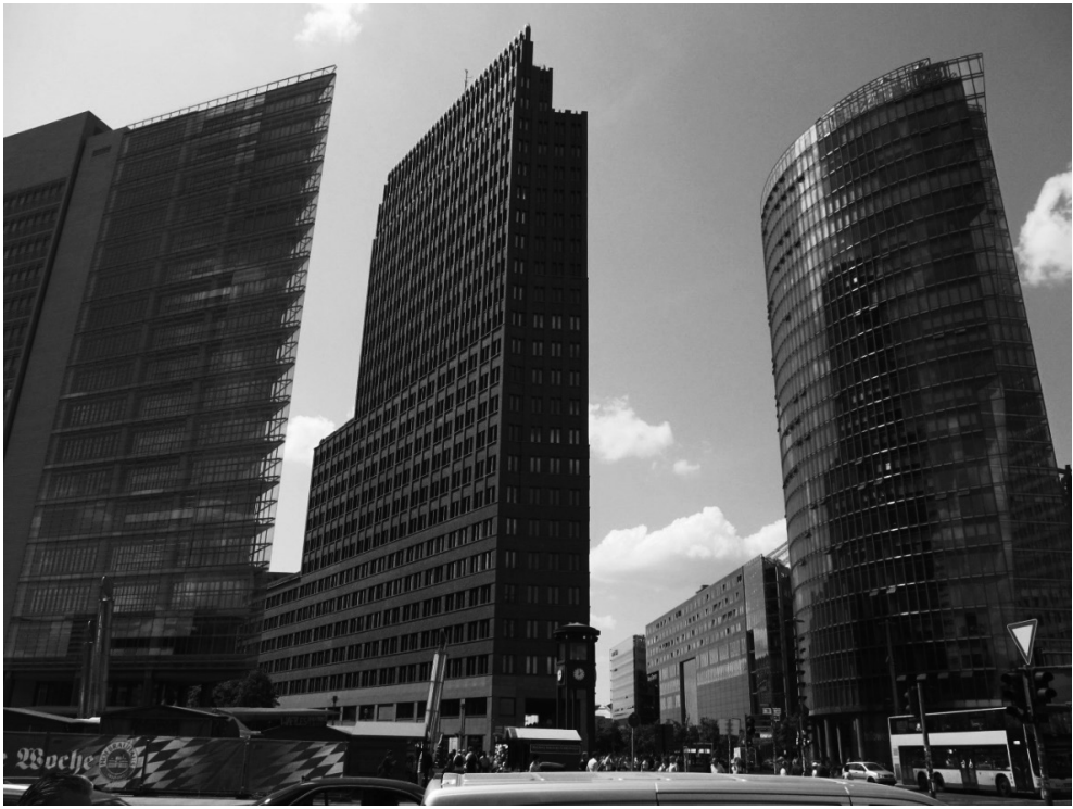
Рис. 4. Берлін. Потсдамська площа після реконструкції у 90-х роках ХХ ст. Справа – штаб-квартира залізничної компанії «Deutsche Bahn AG».

Найбільш суттєва різниця полягає у дії принципу безперервного планування використання територій з урахуванням нагальних громадських потреб та інвестиційних інтересів. Для реалізації цього принципу зацікавлені особи кожне півріччя подають свої пропозиції з обґрунтованими матеріалами до Управління розвитку міста Сенату Берліна. Ці пропозиції розглядаються та публікуються у вигляді графічних схем, де відображається територія, на яку поширюється пропозиція, бажане функціональне використання земельних ділянок та об'єктів нерухомого майна, а також вірогідні екологічні, економічні та соціальні наслідки.