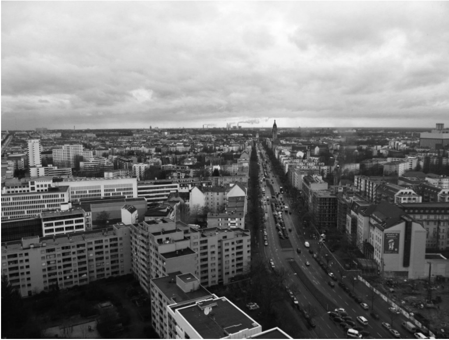
Рис. 10. Сучасна забудова Берліна. Вид на західну частину міста з верхнього поверху будівлі Берлінського технічного університету на площі Ернста Рейтера.