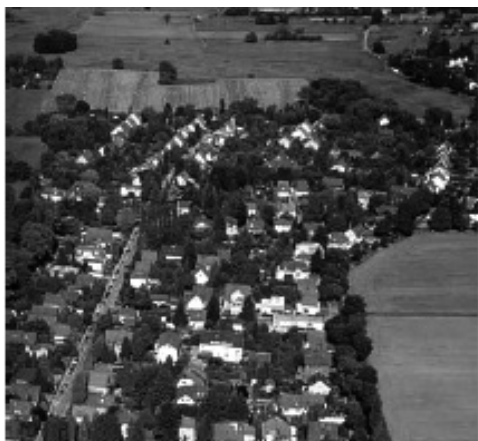
Рис. 9. Нова забудова міськими віллами у районі Штралау (W4)