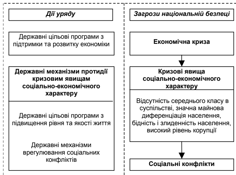
Рис. 3. Перспективні заходи механізмів протидії кризовим явищам соціально-економічного характеру в системі забезпечення національної безпеки

Отже, на кожному з перелічених рівнів необхідні адекватні й ефективні дії органів державної влади. Таким чином, виходячи з наведених вище загроз? можна схематично зазначити перспективні заходи механізмів протидії кризовим явищам соціально-економічного характеру (рис. 3).