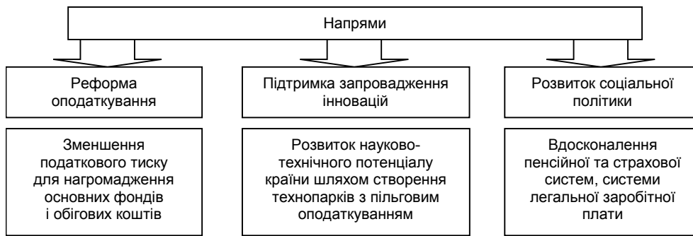
Рис. 1. Напрями участі держави у розвитку КСВ в Україні

Аналіз існуючих у світовій практиці моделей корпоративної соціальної відповідальності (європейської, американської, британської, азіатської) та їх особливостей показав, що участь підприємств у житті суспільства може як жорстко регулюватися законодавством (комерційним, податковим, трудовим, екологічним), так і здійснюватися самостійно під впливом спеціально створених стимулів і пільг. Ці моделі мають як спільні риси – розвиток КСВ шляхом розширення соціальних програм, так і ряд відмінностей, зокрема, якщо соціальні програми американського бізнесу реалізуються через благодійні фонди, філантропію, то у Європі – через соціальні бізнес-проекти; крім того, методи інформаційного супроводження заходів КСВ у США більш різнобічні; якщо в Європі популярним є принцип колективної