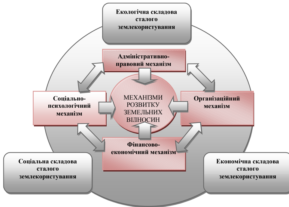
Рис. 1. Концептуальна модель механізмів розвитку земельних відносин

льних відносин у контексті збалансованого використання охорони й відтворення земельних ресурсів як складової просторового соціально-економічного розвитку. Вчені зазначають [16], що механізми розвитку земельних відносин поєднують інструменти та методи адміністративно-правового фінансово-економічного організаційного й соціально-психологічного механізмів у єдиному середовищі економічного, екологічного та соціального аспектів сталого розвитку суспільства (рис. 1).