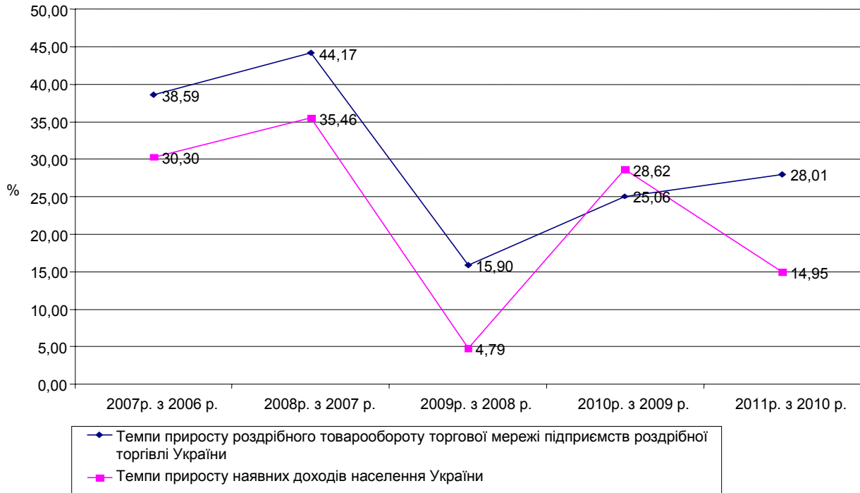
Рис. 1. Порівняльна динаміка темпів приросту роздрібногo товарообороту торгової мережі підприємств роздрібної торгівлі України та наявних доходів населення за 2006–2011 рр. (Розраховано автором на основі даних державного підприємства "Інформаційно-аналітичне агентство" Державної служби статистики України, [9])

наявних доходів населення (рис. 1) свідчить, що за досліджуваний проміжок часу лише у 2010 р. порівняно з 2009 р. темпи приросту наявних доходів населення перевищували темпи приросту роздрібногo товарообороту торгової мережі підприємств роздрібної торгівлі України у 1,14 раза.