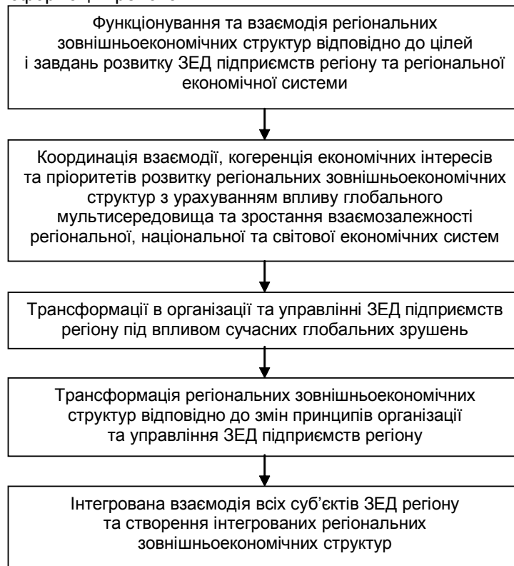
Рис. 2. Послідовність трансформації регіональних зовнішньоекономічних структур під впливом глобалізаційних та інтеграційних процесів

зовнішньоекономічних структур під впливом глобалізаційних та інтеграційних процесів (рис. 2).