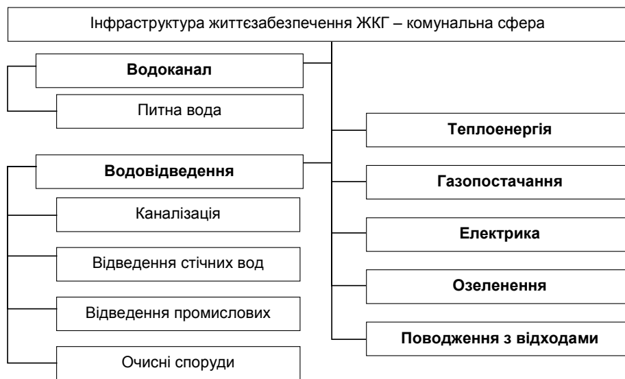
Рис. 2. Складові інфраструктури життєзабезпечення ЖКГ

Інфраструктура життєзабезпечення ЖКГ є базовою для галузі, від її стану та ефективності функціонування залежить стійкість діяльності всього комплексу ЖКГ. На сьогоднішній інфраструктурі властиві високий рівень зношеності основних фондів, суперечливість функцій, високий рівень різних загроз, які виникли завдяки недосконалості законодавчо-нормативної бази. У цьому типі інфраструктури МЖКГ позбавлене функціонально вагомих повноважень і структурно витіснено з цієї сфери державного управління. Самі ж підприємства, які належать до інфраструктури життєзабезпечення, виведені з-під дієвого контролю держави й уже не є елементами процесу державного управління – відсутні планування, комплексний моніторинг і контроль за результатами управлінських рішень. Однак більше занепокоєння викликає те, що