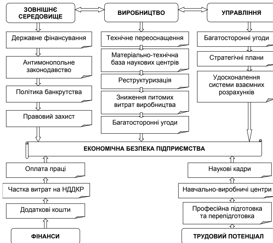
Рис. 2. Схема взаємодії елементів економічної безпеки підприємства

Широкий спектр проблем, з якими пов'язана економічна безпека підприємства, вимагає системного їх розподілу в таких напрямках: технологічна, ресурсна, фінансова й соціальна безпека. Ці підсистеми являють собою комплекс завдань і показників (рис. 2), підвищити її можна, тільки успішно працюючи в усіх напрямках одночасно.