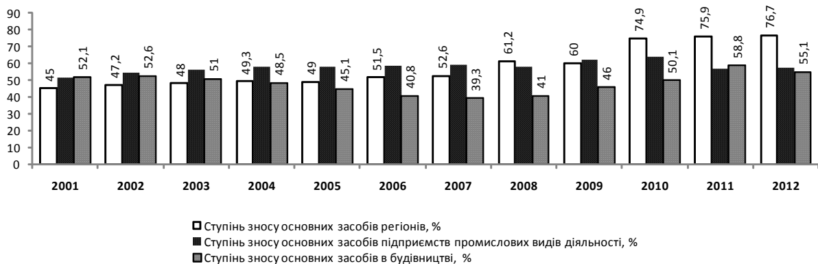
Рис. 3. Ступінь зносу основних засобів у будівництві, %

собів виробництва та зносу основних засобів будівництва українських підприємств за період 2001–2012 рр. наведено на рис. 3 [12].