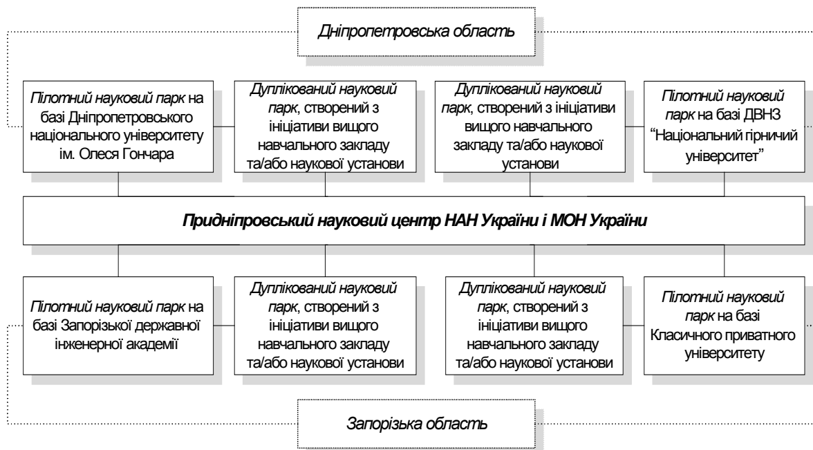
Рис. 2. Етап дуплікації пілотних наукових парків у Придніпровському регіоні

Другий етап – дуплікація. За умови досягнення цілей створення пілотних наукових парків, організація процесу формування дуплікованих наукових парків у інших містах Дніпропетровської та Запорізької областей (рис. 2). На цьому етапі мають бути розглянуті всі три можливі варіанти створення наукових парків: 1) на базі вищого навчального закладу IV рівня акредитації; 2) на базі наукової установи; 3) спільно з науковими установами і ВНЗ IV рівня акредитації.