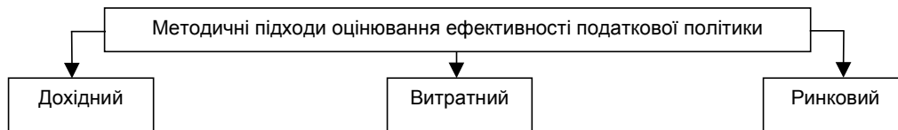
Рис. 1. Методичні підходи оцінювання ефективності податкової політики

Такий підхід дає змогу комплексно оцінити ефективність податкової політики на основі ступеню виконання її функцій, узгодженості із соціально-економічною системою держави та формування конкурентних пе-