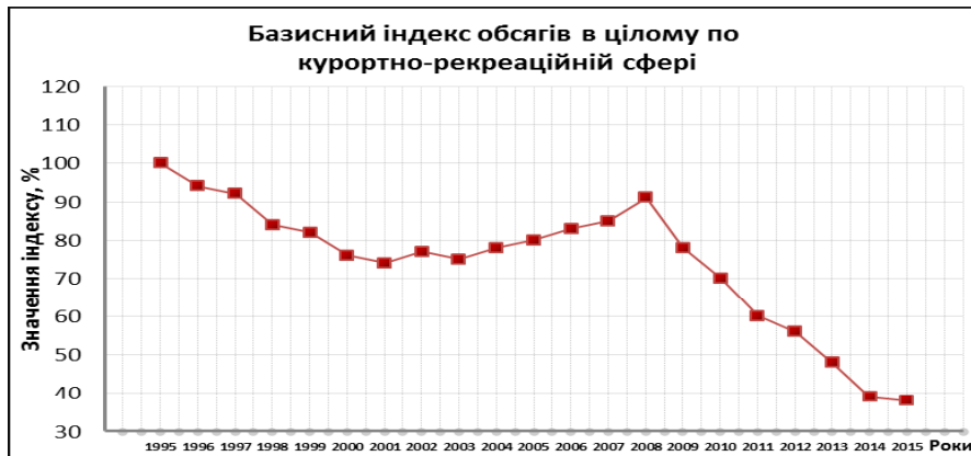
Рис. 1. Базисний індекс обсягів у цілому по курортно-рекреаційній сфері за період з T_1 = 1995 по T_2 = 2015 рр.

У нижній точці спаду (2015) інтенсивність виробництва курортно-рекреаційного продукту становить лише 37% від рівня 1995, тобто лікувально-відновлювальна діяльність скоротилася в 2,6 разу. Такий масштаб трансформаційної кризи зумовлений цілою низкою причин. Одна з загальносистемних причин полягає в тому, що чим складніша система, тим глибшою кризи вона зазнає при трансформаціях.