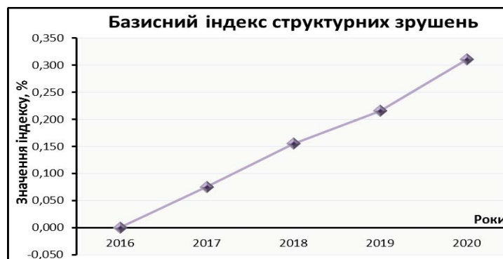
Рис. 4. Базисний індекс структурних зрушень D_{t_1, t_2}

В якості індикатора поступальних структурних зрушень будемо використовувати базисний індекс структурних зрушень D_{t_1, t_2} (рис. 4). Результати розрахунків, подані на рис. 4, показують, що у разі переходу на нову стратегію розвитку за аналізований період у курортно-рекреаційній сфері відбудуться значні зрушення у структурі виробництва курортно-рекреаційних продуктів.