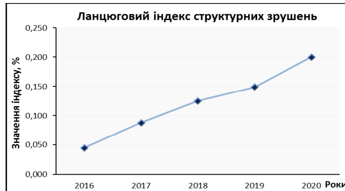
Рис. 3. Індекс інтенсивності структурних зрушень d_t

ри, яка передбачає переважне надання курортно-рекреаційних послуг, інтегрованих з індустріями відпочинку й туризму. Такий перехід завжди супроводжується економічними трансформаціями, пов'язаними з перетворенням існуючої структури курортно-рекреаційних систем, і структурними зрушеннями в економіці. На рис. 3 наведено графік ланцюгового індексу структурних зрушень у виробництві курортно-рекреаційних продуктів d_t , який показує, як швидко в цьому випадку відбуваються структурні зміни.