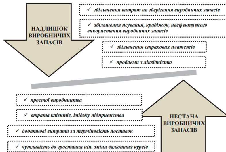
Рис. 2. Наслідки надлишку та нестачі виробничих запасів

Враховуючи цю позицію, очевидно, що для будь-якого суб'єкта господарювання небажаним явищем є як наявність надлишкових виробничих запасів, так і їх нестача. Зокрема, можливі наслідки для підприємства за умови наявності надлишкових виробничих запасів та їх нестачі представлено на рис. 2.