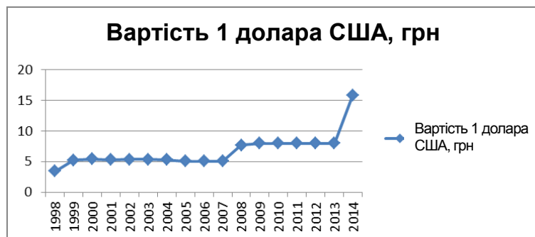
Рис. 2. Динаміка курсу долара США по відношенню до гривні протягом 1998–2014 рр.

На рис. 2 наочно відображено динаміку курсу долара США по відношенню до гривні за період 1998–2014 рр., що дає змогу зіставити зміни, що відбулися за цей період.